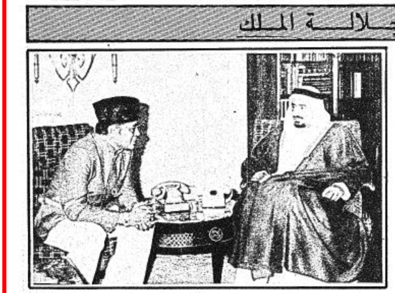
استقبالات جلالة الملك