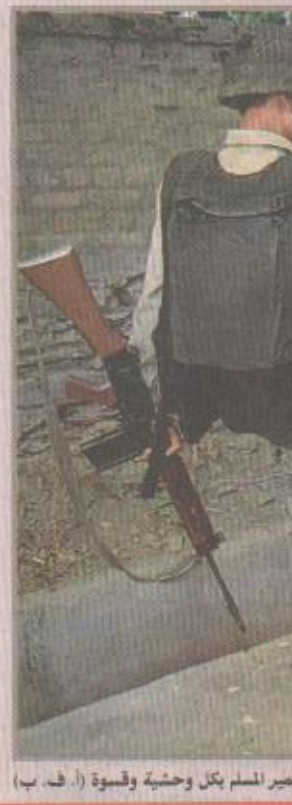
هكذا يعامل جنود الاحتلال الهندي شعب كشمير المسلم بكل وحشية وقسوة

بارامولا/ الهند/ وكالات الأنباء قتل ستة اشخاص في كشمير امس السبت في المرحلة الثالثة من الانتخابات الهندية التي بدأت، فيما استجاب سكان الاقليم لنداء مقاطعة الانتخابات الذي وجهه زعماء حركات المقاومة الاسلامية في كشمير المحتلة لان هذه الانتخابات تضيي شرعية على الاحتلال. وقام مسلحون بمهاجمة صناديق الاقتراع في دائرة بارامولا قرب الحدود مع باكستان وقتلوا النار وقتلوا ثلاثة مدنيين في بلدة شلوات وعشرين من عناصر الامن في دائرة اجاز. واتهم سكان قرية صيفام الجنود بقتل شاب قالوا انه رفض التوجه الى صندوق الاقتراع لادلاء بصوته. وباتمة بارامولا هي واحدة من ست دوائر في كشمير ذات الغالبية المسلمة. وكانت اربع دوائر صوتت في المرحلتين السابقتين بمشاركة ضعيفة جدا في ثلاث منها. ولم يتوجه اي ناخب امس الى العديد من مكاتب الاقتراع. يشار الى ان شعب كشمير المسلم يناضل ضد قوى الاحتلال الهندي منذ عشرات السنين من اجل منحه حقه في تقرير مصيره بمقتضى قرار الامم المتحدة الصادر في ١٩٤٨، والتي ترفض السلطات الهندوسية تطبيقه حتى الان.