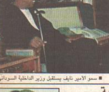
سمو الأمير نايف يستقبل وزير الداخلية السوداني

جدة/ واس استقبل صاحب السمو الملكي الأمير نايف بن عبدالعزيز وزير الداخلية بمكتبه سموه في جدة أمس معالي وزير الداخلية بجمهورية السودان اللواء ركن مهدي عبدالرحيم محمد حسين. وتم خلال اللقاء تبادل الأحاديث الودية وبحث الموضوعات ذات الاهتمام المشترك بين البلدين الشقيقين. وحضر الاستقبال الفئصل السوداني بجدة عبدالرحمن ضرار.