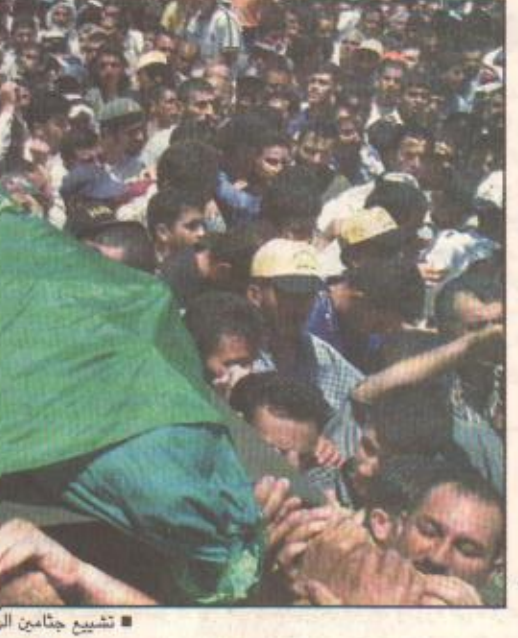
شيع جثامين الشهداء الأربعة الذين قضا برصاص الاحتلال في بيت لحم أمس الأول

بيان عقب اجتماعها أنها ستقوم بهامسة أقصى ضد الفلسطينيين. ونشر جيش الاحتلال سزيبا من التفتيزات من الجنود والمعدات والذبابات وبطاريات الصواريخ والمروحيات في شمال وجنوب الضفة الغربية. حسبما أعلنت السلطات العسكرية وشهود العيان. ونفى وزير الخارجية شعومون بيرس ان حكومة ارييل شارون تخطط لإعادة احتلال مناطق الحكم الذاتي، وحذر وزير تشجيع جثامين الشهداء الأربعة الذين قضا برصاص الاحتلال في بيت لحم أمس الأول حسني مبارك، انه لا حل مع شارون الذي لا يعرف الا القتل والفسر والحرب. وقال مبارك في حديث مع وكالة انباء الصين الجديدة نشرته وكالة انباء الشرق الأوسط المصرية. الآن الوضع مختلف تماما ولا يبدو ان هناك حلا مع شارون فمباركة هو استخدام القوة وبلغة لا يقل السلام، وبمراجعة أكثر، انا لا أرى املا مع شارون ومجموعته التي تضم المتطرفين.