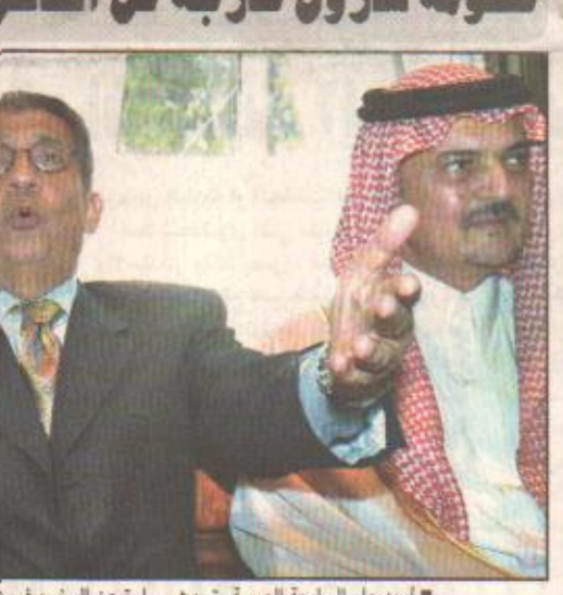
امين عام الجامعة العربية يتحدث بمبرة عن الوضع في فلسطين وعلى يساره الأمير سعود الفيصل والرئيس عرفات على يمينه

خميس مشيط/ احمد الشيع افتتح صاحب السمو الملكي الأمير سلطان بن عبدالعزيز النائب الثاني لرئيس مجلس الوزراء وزير الدفاع والطيران والمفتش العام أمس معرض القوات المسلحة الثالث المقام في قاعدة الملك خالد الجوية بالمنطقة الجنوبية بحضور صاحب السمو الملكي الأمير خالد الفيصل أمير منطقة عسير وأصحاب السمو الملكي الأمراء وكبار الضباط والمسؤولين في المنطقة الجنوبية. وقد استقبل سمو النائب الثاني ومرافقه عربة قام فيها بجولة على الأليات والأسلحة المشاركة في المعرض من القوات البرية والجوية والبحرية وقوات الدفاع الجوي وشاهد نماذج من الأسلحة الثقيلة كالدبابات والمدافع والصواريخ وناقلات الجنود والفرقاطات والطائرات العمودية والغواصات وكامحات الأوامر وصواريخ الباليستية والهوك والشاهين والكراتول وأسترال. وقال قائد المنطقة الجنوبية اللواء الركن حسين القبيل في كلمة ألقاها خلال حفل خطابي أقيم بهذه المناسبة ان هذا المعرض الذي يقام بتوجيه كريم من سمو النائب الثاني أصبح واقعا ملموسا بعد ان كان فكرة من ركان التنشيط السياسي الأول في منطقة عسير صاحب السمو الملكي الأمير خالد الفيصل. وقال قائد قاعدة الملك خالد الجوية بالجانبية اللواء طيار ركن محمد الجمي ان معرض العام تم تجهيزه بـ ١٠٩ وحدات من المعدات والأليات و٢٧ طائرة للعرض الجوية والأرضية وأضاف انه تمت الاستفادة من التجهيزات من أجل سهولة وصول الزوار وسهولة تنقلهم بين أجهزة المعرض وخلال الحفل الخطابي هطلت أمطار مصعوبة بزخات من البرد على محافظة خميس مشيط أدت إلى توقف برنامج حفل افتتاح معرض القوات المسلحة الثالث، عنعا غادر سمو النائب الثاني وسط هدوء الأجواء المنطرة - جعلها له امطار خير وبركة. (طالع ص ٣)