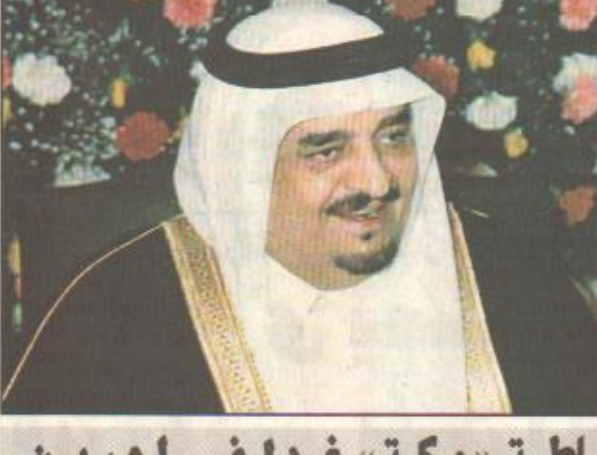
تدشين الفرقاطة «مكة» غدا في لورين

الرياض/ واس صدر الأمر الملكي التكريم رقم ١٢١/ ١٦٦ وتاريخ ١٤٢٢/ ٤/ ١٦ هـ بترقية العماد بوزارة الداخلية التالية أسماؤهم إلى رتبة لواء اعتباراً من ١٤٢٠/ ٤/ ١٤ هـ وهم: عبدالعزيز بن عبدالله البواقي وخالد بن صباح المنديل ومجاهد بن نومي الجريس. كما صدر الأمر الملكي رقم ١٢١/ ١٦٦ وتاريخ ١٤٢٢/ ٤/ ١٦ هـ بترقية العميد بوزارة الداخلية سالم بن سعد بن عبدالعزيز السالم وناصر بن حمد بن ناصر الضاري إلى رتبة لواء اعتباراً من ١٤٢٠/ ٤/ ١٤ هـ وصدر الأمر الملكي رقم ١٢٠/ ١٦٦ وتاريخ ١٤٢٢/ ٤/ ١٦ هـ بترقية العميد بوزارة الداخلية خالد بن سليمان الخليلوي وعبدالرحمن بن عبدالعزيز السكيت إلى رتبة لواء اعتباراً من ١٤٢١/ ٢/ ٢٠ هـ. الرياض/ واس بتوجيه من صاحب السمو الملكي الأمير سلطان بن عبدالعزيز النائب الثاني لرئيس مجلس الوزراء وزير الدفاع والطيران والمفتش العام والشيخ مشيخة الله - صاحب السمو اللواء البحري الركن فهد بن عبدالله بن محمد آل سعود نائب قائد القوات البحرية غدا الجمعة مدينة لورين الفرنسية للفرقاطة الثانية ضمن مشروع صواري (٢) التي تحمل اسم (مكة) وبهذه المناسبة ألقى سمو نائب القوات البحرية بتصريح قال فيه: لقد تشرفت بحضور هذه المناسبة بناء على توجيهات صاحب السمو الملكي النائب الثاني لرئيس مجلس الوزراء وزير الدفاع والطيران والمفتش العام - يحفظه الله - والناعبة من اهتمام سموه الكريم الدائم بقواتنا المسلحة.