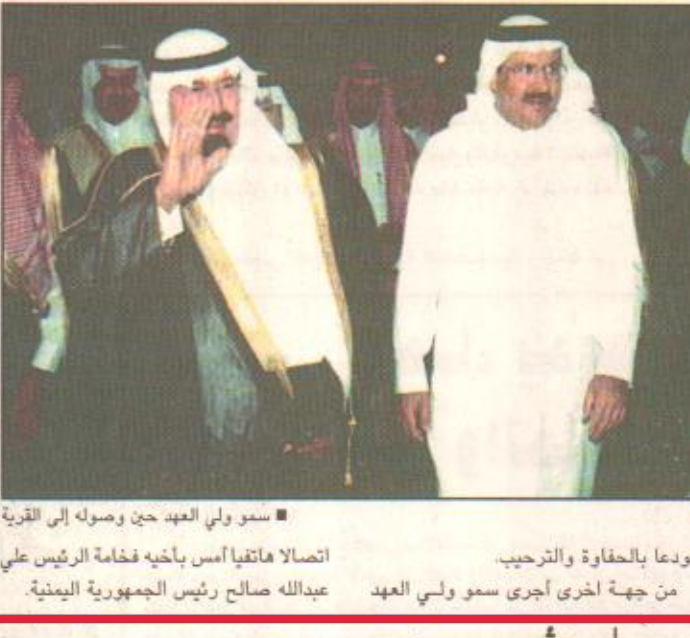
سمو ولي العهد جن وصوله إلى القرية اتصالاً هاتفياً أمس بأخيه فخامة الرئيس اليمني عبدالله صالح رئيس الجمهورية اليمنية. مودعا بالتحفاة والترحيب من جهة أخرى أجرى سموه ولي العهد

جدة/ عبد العزيز جازان/ واس قام صاحب السمو الملكي الأمير عبدالله بن عبدالعزيز ولي العهد نائب رئيس مجلس الوزراء رئيس الحرس الوطني الليلة الماضية بزيارة إلى قرية مرسل الترفيهية في محافظة جدة. وقور وصول سموه قادم بجولة داخل القرية شملت مراحل المشروع كافة وكما في عاده سموه توقف في أكثر من موقع للائتمار برواد القرية وبإبناسه المواطنين حيث قوبل بالتهات والترحيب من الجميع وبإدبهم سموه بالتهات وبمطهها حيث قدمت مجموعة من الأطفال باقات من الورد تعبيراً عن مودتهم ومحبتهم لسموه الكريم الذي قبلهم في أبوة حانية تعكس عمق الرابطة بين قيادة هذا الوطن وشعبه الوفي. كما شاركهم سموه الكريم استمتاعهم بوقتهم الطيب الذي يقضونه في هذه القرية. وبعد انتهاء جولة سموه ولي العهد تناول ورفاقوه طعام العشاء بعدها غادر سموه وإطمان سموه ولي العهد خلال الاتصال على نتائج الفحوصات الطبية التي أجراها الرئيس علي عبدالله صالح في جمهورية المنيا الاتحادية مشتملاً لفخامته موفور الصحة والسعادة وللشعب اليمني الشقيق اطرد التقدّم والازدهار. كما جرى خلال الاتصال بحث العلاقات الأخوية والقضايا والمستجدات التي تهم البلدين الشقيقين والأمة العربية. من جهة أعرب فخامة الرئيس علي عبدالله صالح عن شكره وتقديره لآخيه صاحب السمو الملكي الأمير عبدالله بن عبدالعزيز على مشاعره الخيرة مطمئناً سموه على نتائج الفحوصات الطبية الروشينة التي أجراها مشتملاً لسموه موفور الصحة والسعادة وللشعب المملكة العربية السعودية المزيد من التقدّم والازدهار. (طالع ص ١١)