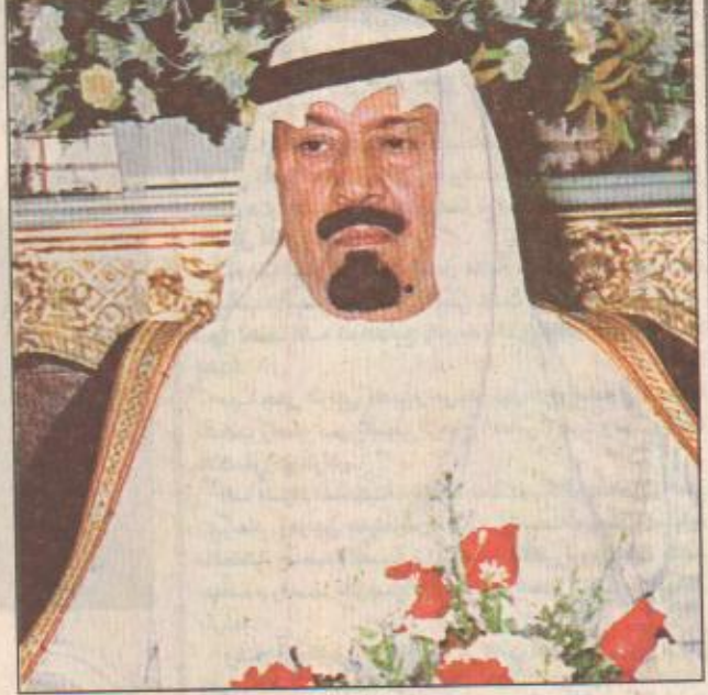
سمو ولي العهد

جدة/واس استقبل صاحب السمو الملكي الأمير عبدالله بن عبدالعزيز ولي العهد ونائب رئيس مجلس الوزراء ورئيس الحرس الوطني في مكتب سموه بالديوان الملكي بقصر السلام بجدة أمس أصحاب السمو الملكي الأمراء وأصحاب المعالي الوزراء وكبار المسؤولين وقادة وضباط الحرس الملكي في القطاع الغربي الذين قدموا للسلام على سموه وتهنئته بسلامة الوصول وحضر الاستقبال صاحب السمو الملكي الأمير ماجد ابن عبدالعزيز أمير منطقة مكة المكرمة وصاحب السمو الملكي الأمير عبدالعزيز بن عبدالله ابن عبدالعزيز المستشار في ديوان سمو ولي العهد وصاحب السمو الملكي الأمير مشعل بن ماجد ابن عبدالعزيز محافظ محافظة جدة.