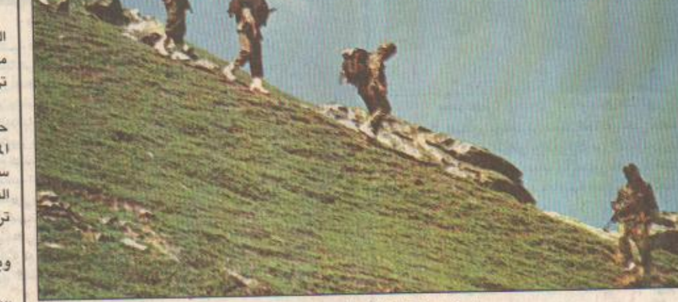
الهند تعزز قواتها في كشمير (١٠ ب)

سريغار (كشمير) - وكالات الأنباء استأنفت القوات الهندية أمس هجومها ضد مقاتلي حركة الاستقلال المتحصنين في جبال كشمير بعدما حذرت باكستان من أن فرض السلام تتضاءل بينما تتصاعد احتمالات النزاع. وكررت مصادر عسكرية أن قصفاً مدغيفياً عنيفاً كان يدور حتى نهار أمس في قطاعي باتاليك وتايغر هيلز الجبلين. وما زال ٥٠ إلى ٦٠ مقاتلاً كشميرياً يقاومون في قطاع تايغر هيلز الواقع في القطاع الخاضع للاحتلال الهندي على ارتفاع ٤٩٠٠ متراً قرب خط المراقبة الفاصل بين باكستان والهند وذلك على الرغم من كثافة القصف الهندي. ويشكل قطاع تايغر هيلز هدفا رئيسيا للجيش الهندي بعدما استعاد السيطرة على بعض المرتفعات. وتضاربت المعلومات حول ضحايا المعارك المندلعة منذ ستة أسابيع. فبينما اشارت الهند إلى وقوع ١٦٣ قتيلاً على الأقل و٣٢٢ جريحاً في صفوفها ومقتل ٣٣٩ باكستانياً ذكرت باكستان أن ٤٧ باكستانياً و٣٠٠ هندي على الأقل قتلوا. وزعم الجيش الهندي أن ٦٠٠ إلى ٧٠٠ جندي من القوات الباكستانية ما زالوا يسيطرون على بعض الجيوب في القطاع الخاضع للهند من كشمير لحماية ٢٠٠٠ من مقاتلي حركة الاستقلال الكشميريين. ونقلت باكستان أن تكون لديها في كشمير الهندية آية وحدات عسكرية وأكدت عدم مسؤوليتها عن نسل المقاتلين.