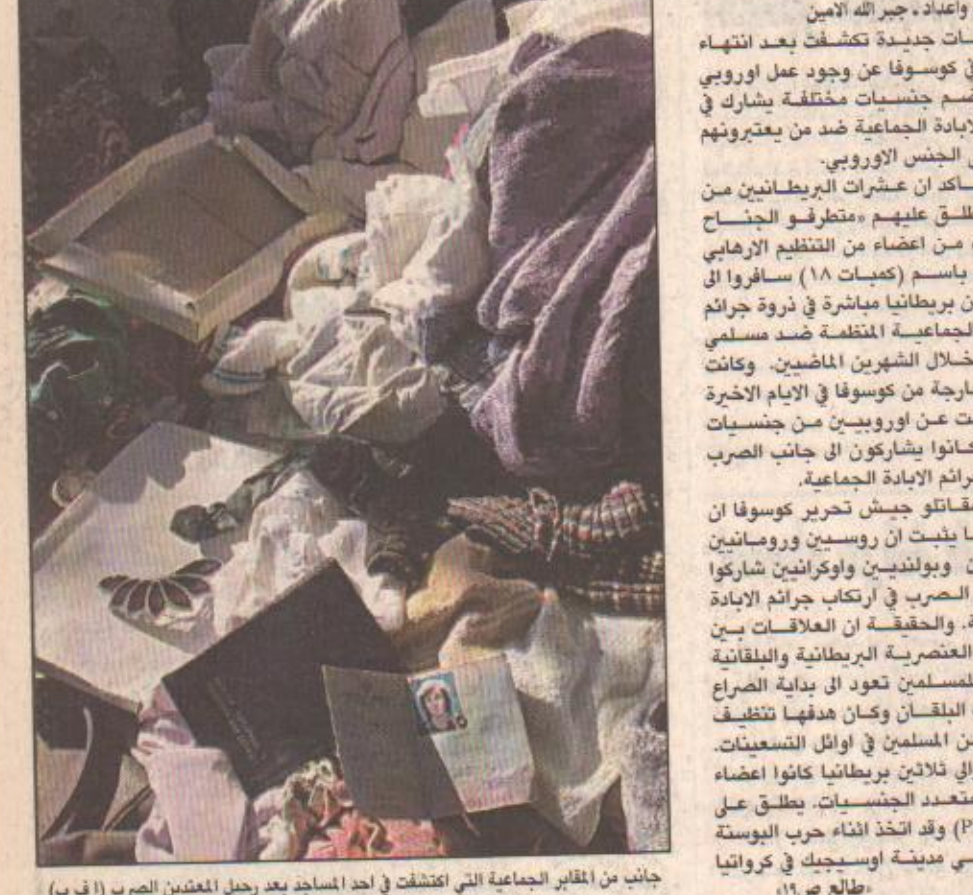
جانب من المخابر الجماعية التي اكتشفت في أحد المساجد بعد رحيل المعتنقين الصرب (١٠ ب)