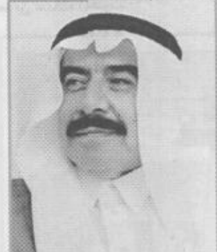
الدكتور محمد الجارالله

بافتتاح معالي وزير الشؤون البلدية والقروية الدكتور محمد الجارالله يوم غد الاثنين ورشة العمل الخاصة بهندسة الزلازل والتي تنظمها الوكالة اليابانية للتعاون الدولي (جايتكا) وتستمر يومين. صرح بذلك الممثل المقيم لجايتكا بالمملكة كونيها تاجاتا وقال أنه سوف تلقى خلال ورشة العمل العديد من المحاضرات بمشاركة محاضرين من جامعة الملك سعود ومدينة الملك عبدالعزيز للعلوم والتقنية حيث ستركز تلك المحاضرات على الشبكة المحلية بالمملكة لرصد الزلازل والهزات الأرضية. وأشار تاجاتا إلى أن اليابانيين سيركزون خلال ورشة العمل هذه على موضوعات الاحتياطات التي تؤخذ في الاعتبار لمقاومة أخطار الزلازل والطرق الفنية لتحسين الكفاءة الزلزالية للمباني والجسور القائمة.