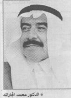
الدكتور محمد الجارالله

بافتتاح معالي وزير الشؤون البلدية والقروية الدكتور محمد الجارالله يوم غد الاثنين ورشة العمل الخاصة بهندسة الزلازل والتي تنظمها الوكالة اليابانية للتعاون الدولي (جايتكا) وتستمر يومين. صرح بذلك الممثل المقيم لجايتكا بالمملكة كونيها تاجاتا وقال أنه سوف تلقى خلال ورشة العمل العديد من المحاضرات بمشاركة محاضرين من جامعة الملك سعود ومدينة الملك عبدالعزيز للعلوم والتقنية حيث ستركز تلك المحاضرات على الشبكة المحلية بالمملكة لرصد الزلازل والهزات ارضية. واشار تاجاتا إلى ان اليابانيين سيركزون خلال ورشة العمل هذه على موضوعات الاحتياطات التي تؤخذ في الاعتبار لمقاومة أخطار الزلازل والطرق الفنية لتحسين الكفاءة الزلزالية للمباني والجسور والقائمة.