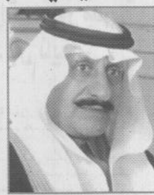
أمير منطقة الحدود الشمالية