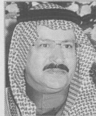
عبدالمجيد بن عبدالعزيز