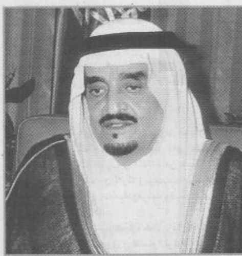
مئاسد الحج بالأسلوب والمنهج العلمي الشرعي الصحيح. وأقاد أن تلك المواد تتضمن جهود المملكة العربية السعودية بقيادة خادم الحرمين الشريفين الملك فهد بن عبدالعزيز...