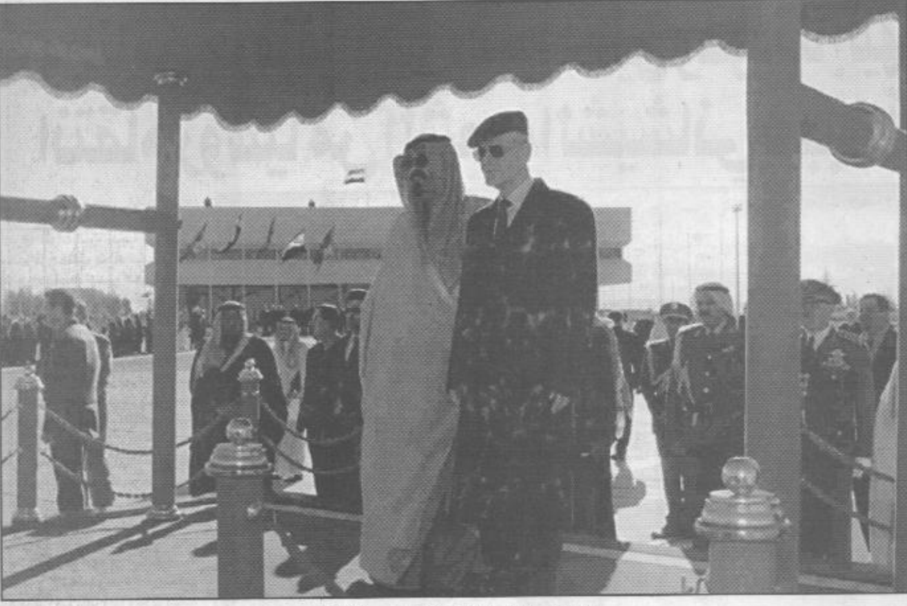
ولي العهد والرئيس السوري خلال مراسم الاستقبال