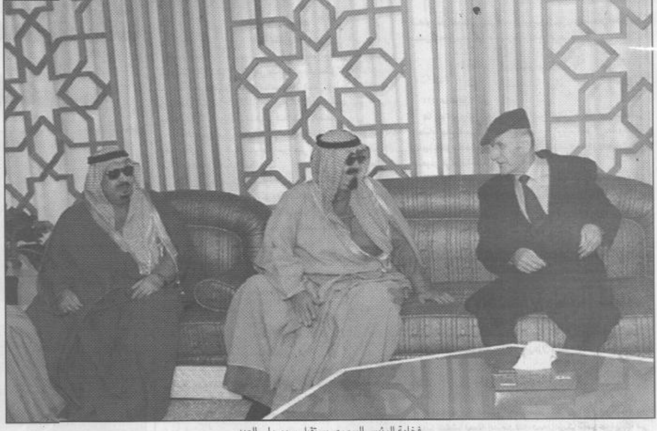
فخامة الرئيس السوري يستقبل سمو ولي العهد