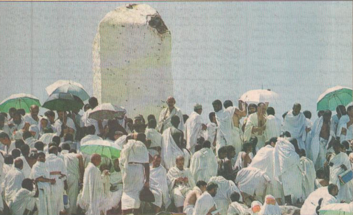
جموع الحجاج أثناء الوقوف بعرفة

وقد استقبل صعيد عرفات مع إشراقة صباح أمس التاسع من ذي الحجة قوافل حجاج بيت الله الحرام الذين تألف جمعهم في مواكب إيمانية تحفرهم السكينة والخشوع منضرعين إلى الموقبلين وداعين المغفرة والعفو والرحمة والعطف من النار في يوم لم تلغ الشمس على خير منه، ويشارك ضيوف الرحمن جموع المسلمين في مختلف أنحاء المعمورة بمشاعر إيمانية شعائر هذا التجمع الإسلامي عبر البث المباشر لمختلف وسائل الإعلام المرئية والمسموعة لوقوف الحجاج وادابهم وشعائهم على صعيد عرفات، وقد أدى حجاج بيت الله الحرام بعد أن اكتمل جمعهم على صعيد عرفات الطاهر أمس صلاتي الظهر