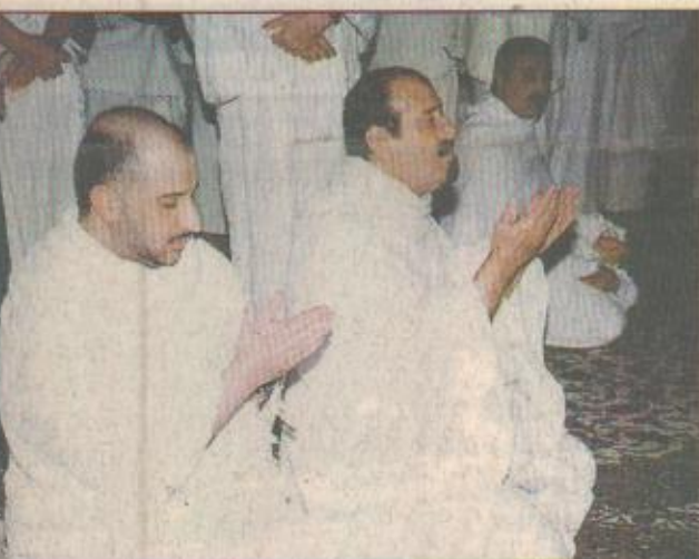
سمو ولي العهد يؤدي مناسك الحج