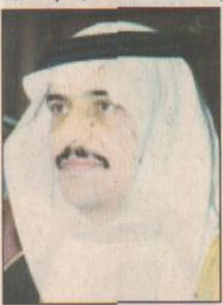
الأمير محمد بن فهد

الدمام - عبدالله القشري يتقدم صاحب السمو الملكي الأمير محمد بن فهد بن عبدالعزيز أمير المنطقة الشرقية وصاحب السمو الملكي الأمير سعود بن نايف بن عبدالعزيز نائب أمير المنطقة الشرقية جموع المصلين لإداء صلاة عيد الأضحي المبارك بمصلى العيد بالدمام.