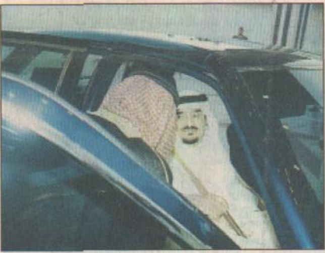
خادم الحرمين الشريفين يصل إلى منى