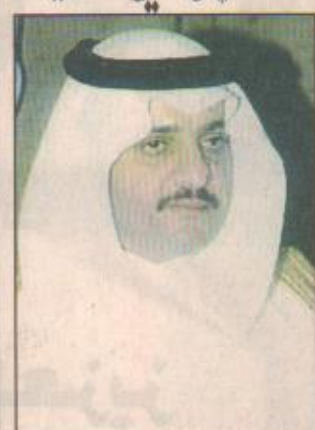
الأمير سعود بن نايف