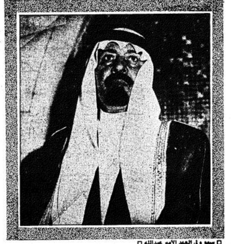
سمو ولي العهد الأمير عبدالله