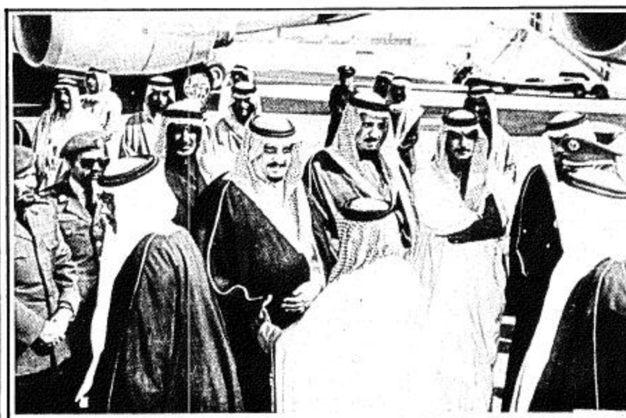
المواطنون يودون جلالة الملك

الجزائر - واس - وحسين الفراج تفضل جلالة الملك فهد بن عبدالعزيز المفدى بالحديث الثاني لوكالة الأنباء السعودية لدى وصول جلالة حفظه الى الجزائر مساء أمس فقل جلالته... انه لما بعلا نفسي سعادة واعتزازا ان اقوم بزيارة جزء عزيز من الوطن العربي الكبير وان التقى بفخامة الرئيس الشاذلي بن جديد خاصة في هذه الفترة الحاسمة من تاريخ امتنا العربية والاسلامية التي تواجه فيها مختلف التحديات مما يفرض علينا جميعا تحمل المسؤولية الضخمة التي تنسب هذه الرحلة وتبادل الرأي والتشاور حول افضل السبل لتدعيم وتوطيد العلاقات الثنائية القائمة بين البلدين والشعبين الشقيقين وتكريس [ البقية على ص ٣٠ ]