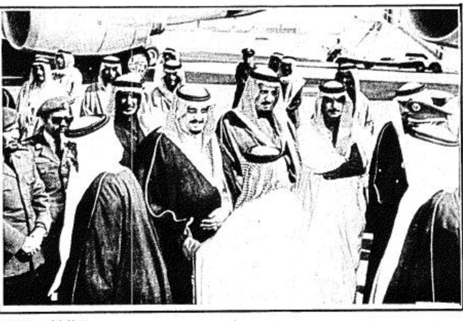
المواطنون يودعون جلالة الملك

الجزائر - واس - وحسين الفراج تفضل جلالة الملك فهد بن عبدالعزيز المفدى بالحديث التالي لوكالة الأنباء السعودية لدى وصول جلالة حفظه الى الجزائر مساء أمس فقل جلالتة... انه لما يعلا نفسي سعادة واعتزازاً ان اقوم بزيارة جزء عزيز من الوطن العربي الكبير وان التقى بفضامة الرئيس الشاذلي بن جديد خاصة في هذه الفترة الحاسمة من تاريخ امنا العربية والاسلامية التي تواجه فيها مختلف التحديات مما يفرض علينا جميعاً تحمل المسؤولية الضخمة التي تنسب هذه المرحلة وتبادل الراي والتشاور حول افضل السبل لتدعيم وتوطيد العلاقات الثنائية القائمة بين البلدين والشعبين الشقيقين وتكريس [ البقية على ص ٣٠ ]