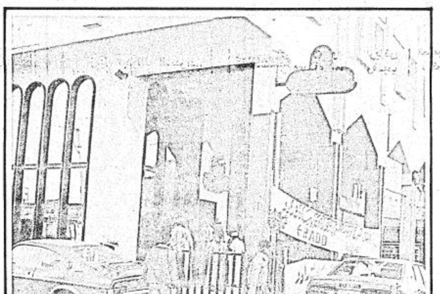
منظر آخر للمعرض نفسه تبدو فيه روعة التصميم والذوق الفني الرفيع .