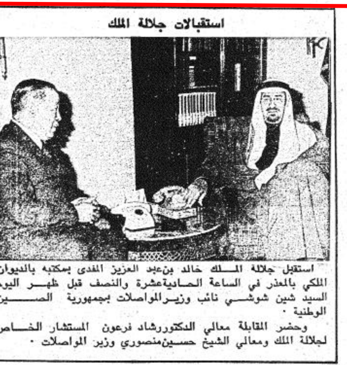
استقبل جلالة الملك خالد بن عبد العزيز الذي يملكه بالديوان الملكي بالعذر في الساعة السادسة عشرة والنصف قبل ظهر اليوم السيد شين شوشي نائب وزير المواصلات بجمهورية الصين الوطنية.

● كتب رئيس التحرير شلتما كان يوم امس هو يوم الحرس الوطني.. فقد كان يومنا نحن في - الجزيرة - ايضا.. فمند شهر ونحن نحاول مخاطبة سمو ولي العهد والحديث معه واليه عن كثير من قضايا الساعة المطروحة.. عرضنا هذه الرغبة على سموه في بغداد اثناء مؤتمر القمة فوجد.. وعرضناها عليه في مناسبات كثيرة فأكد الوردولت الجزيرة - وكلها تفاؤل وامل - متمسكة بوعد الرجل الكبير.. وهي على يقين بأن سموه سوف يفي بوعدته.. وأمس كانت الفرحة.. استقبل سموه الجزيرة.. تحدث إليها في حدود مايسمح به وقته.. قال عن الحرس الوطني الكثير وهو يبدو فخوراً بهذه الطليعة الطيبة من ابناءنا وتحدث عن قضية فلسطين معلناً ثبات موقف المدد واصالة تصورنا لهذه المشكلة.. ولم يكن حديثه من الاهمية بقدر ما لحديث الفهد من اهمية ليمر دون ان يتحدث سموه عن المستقبل الواعد بالخير والرأفة لابناء هذا البلد وهذا ما تضمنته حديث الفهد الهام والصريح لنا.. فقد أكد سموه (للجزيرة) وكل دقيقة احتفالاً بانجاز جديد بان اعز شيء الى قلبه وقلوب لاننا بذلك نشعر باننا اماناء على المسئولين وعلى راسهم جلالة العهد ووفياء لهذه الأمة.. وقال انني في موقع من الملك خالد ان يعرض كل يوم