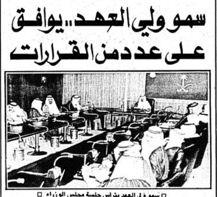
الرياض - واس - عقد مجلس الوزراء جلسة مساء أمس برئاسة صاحب السمو الملكي الأمير عبد الله بن عبد العزيز ونائب رئيس مجلس الوزراء ورئيس الحرس الوطني وزير الداخلية يوم السبت القادم. كما يصادف اليوم عيد الأضحى المبارك في المملكة العربية السعودية.