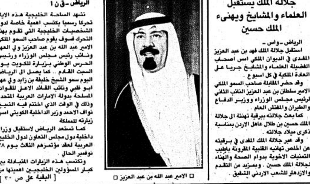
الامير عبد الله بن عبد العزيز

تشهد الساحة الخليجية هذه الأيام تحركا رسميا يتكسب أهمية خاصة لدور الشخصيات الخليجية التي تقوم بهذا التحرك فسوف يقوم صاحب السمو الملكي الأمير عبد الله بن عبد العزيز ولي العهد ونائب رئيس مجلس الوزراء ورئيس الحرس الوطني وزير الداخلية يوم السبت القادم. كما يصادف اليوم عيد الأضحى المبارك في المملكة العربية السعودية.