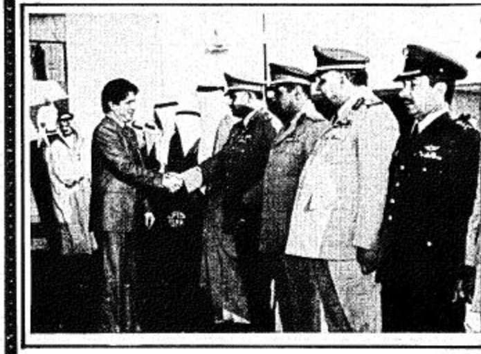
أربع لفظت من مغفرة الرئيس اللبناني لحظر الملك خالد الدولي