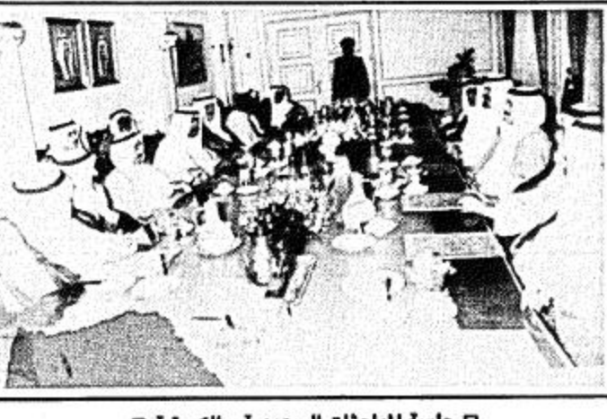
جلسة المباحثات السعودية - الكويتية