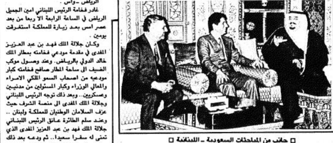
جانب من المباحثات السعودية - اللبنانية