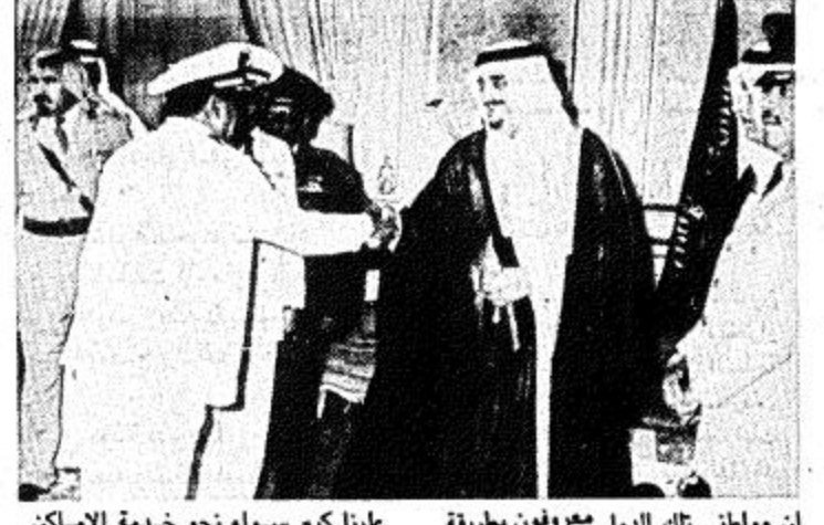
عينا كبير سواء نحو خدمة الاسكان الفسة او ما تقوم به من اعمال لتسهيل امر الحجيج وكلها واجب من الواجبات اصف الى ذلك انه لا بد ان يكون هذا مدعوما بقوة عسكرية تستطيع ان تدافع عن العقيدة اذا اراد من تسول له نفسه ان يسيء الى عقيدتنا الاسلامية الصريحة والواضحة وجه حفظه الله الدعوة نداء لجميع الخريجين من الجامعات وخريجي الثانوية العامة وخريجي المساهد ان يلتحقوا بالقوات العسكرية وقال حفظه

اه انه عندما اوجه نداء فاني اعرف انه محب للتفوس وليس القصد منه ارقام ايماننا المتخزين ان يلتحقوا بالقوات العسكرية كما ان ليس من اللازم ان يلتحقوا بالكلية الجامعية. وقال حفظه الله ولكننا في حاجة دائما الى ان نعمل الى المستوى والعدد الذي نرغب ان نعمل اليه سواء بالنسبة للقوات البرية او البحرية او الجوية. مؤكدا ان تزايد القوات العسكرية مع بعضها البعض لا كانت جوية او بحرية او برية وانتشارها يجعل منها اطارا واحدا واستيعاب ضباطها وجنودها لا يتطلب منهم جعل منها منهم اطارا واحدا لانك لا تعرف متى ياتي الخطر ولو عرفت ان الانسان وقتنا محددا لحدثت مشكلة فانه يمكن الاستعداد لها لكن يجب ان تكون نحن على اهبة الاستعداد وان نبدل ما نستطيع من مجهود في الوقت الحاضر. ووصف حفظه الله المظالم العقيدة الاسلامية وانها رجعية باتهم اعداء لنا والدولالانسان لا يعمه ان يقول اي شيء وقال لكتني استطيع ان اقيم العجة عليه بشكل اياخر.