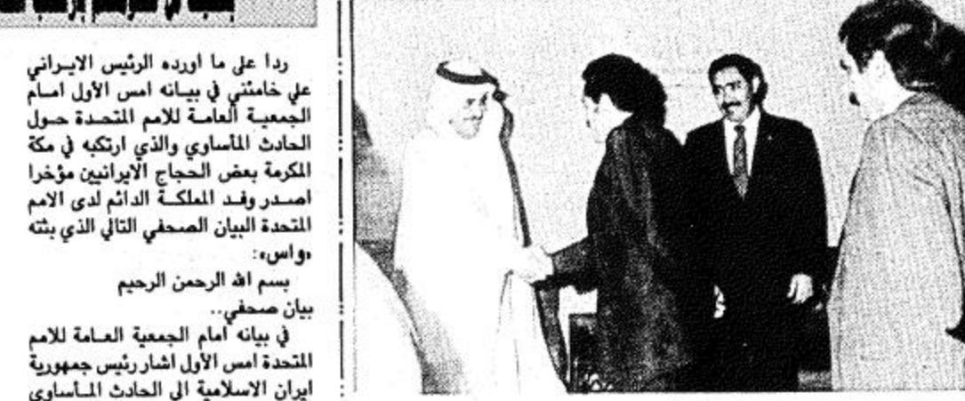
يركس رغبة قائدتي البلدين والشعبين الشقيقين في تحقيق المزيد من التعاون البناء بينهم، وترجمة لعلاقات ذات جذور تاريخية وحضارية وعربية واسلامية. (البلقية ص ٣٠)

وقال سموه في تصريح لـ دواس، قبل مغادرته جدة انه يحمل رسالة خفية من خادم الحرمين الشريفين الملك فهد بن عبدالعزيز الى اخيه الرئيس علي عبدالله صالح رئيس الجمهورية العربية اليمنية تتناول سبل تعزيز التعاون وحسن الحوار القائم بين البلدين. ونوه سموه في هذا الصدد بمجلس التنسيق السعودي اليمني وقال انه