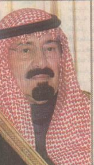
نائب خادم الحرمين الشريفين

جدة - واس بعث نائب خادم الحرمين الشريفين صاحب السمو الملكي الأمير عبدالله بن عبدالعزيز برفيقة تهنئة لفخامة الرئيس العميد محمد القذافي قائد ثورة الفاتح من سبتمبر بمناسبة ذكرى اليوم الوطني لبلاده. وأعرب صاحب السمو الملكي الأمير عبدالله بن عبدالعزيز باسم خادم الحرمين الشريفين الملك فهد بن عبدالعزيز ونياية عن شعب وحكومة المملكة العربية السعودية وباسمه شخصياً عن أخلص التهاني الودية مقرونة بتمنيات سموه الأخوية بدوام الصحة والسعادة لفخامة الرئيس العميد محمد القذافي وموقور الخير والرخاء لشعب ليبيا الشقيق. من جهة أخرى بعث نائب خادم الحرمين الشريفين صاحب السمو الملكي الأمير عبدالله بن عبدالعزيز برفيقة جوابية إلى معالي وزير الشؤون الإسلامية والأوقاف والدعوة والإرشاد هذا نصها. معالي الشيخ صالح بن عبدالعزيز بن محمد آل الشيخ وزير الشؤون الإسلامية والأوقاف والدعوة والإرشاد السلام عليكم ورحمة الله وبركاته. فقد تسلمنا برفيقة معاليكم بمناسبة عقد ملتقى خادم الحرمين الشريفين الملك فهد بن عبدالعزيز آل سعود الإسلامي الثنائي الذي نظفتته وزارة الشؤون الإسلامية والأوقاف والدعوة والإرشاد في بروكسل برعاية صاحب السمو الملكي الأمير عبدالعزيز بن فهد بن عبدالعزيز وزير الدولة وعضو