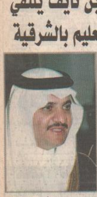
الأمير سعود بن نايف

الدمام - فيصل القو يستقبل صاحب السمو الملكي الأمير سعود بن نايف بن عبدالعزيز نائب أمير المنطقة الشرقية ظهر اليوم الاثنين السادس والعشرين من الشهر الحالي بمنسوبي التعليم بالمنطقة برئاسة معالي مدير التعليم بالمنطقة الشرقية الدكتور صالح بن جاسم الدوسري بحضور مدير التعليم بالإحصاء الدكتور عبدالرحمن المديرس ومدير التعليم بحفر الباطن الأستاذ سعود الدريس ومديري الإدارات وبعض مديري المدارس والمعلمين بقصر الإمارة وذلك بمناسبة بدء العام الدراسي الجديد ١٤٢٠/١٤٢١هـ. وأعرب مدير عام التعليم بالمنطقة الشرقية الدكتور صالح بن جاسم الدوسري عن اعتزازه ومنسوبي التعليم بالانتماء بصاحب السمو الملكي نائب أمير المنطقة الشرقية والاستئناس بتوجيهاته الكريمة في بداية العام الدراسي حيث عودنا سموه الترحيب على ذلك في بداية كل عام دراسي. وأعرب باسمه ومنسوبي التعليم عن عظيم شكره وتقديره لسمو الأمير سعود بن نايف بن عبدالعزيز على هذه اللفتة الكريمة من سموه.