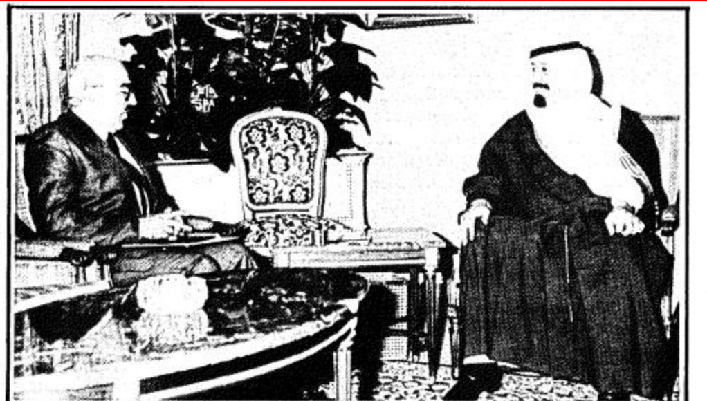
سمو ولي العهد يستقبل السفير العراقي