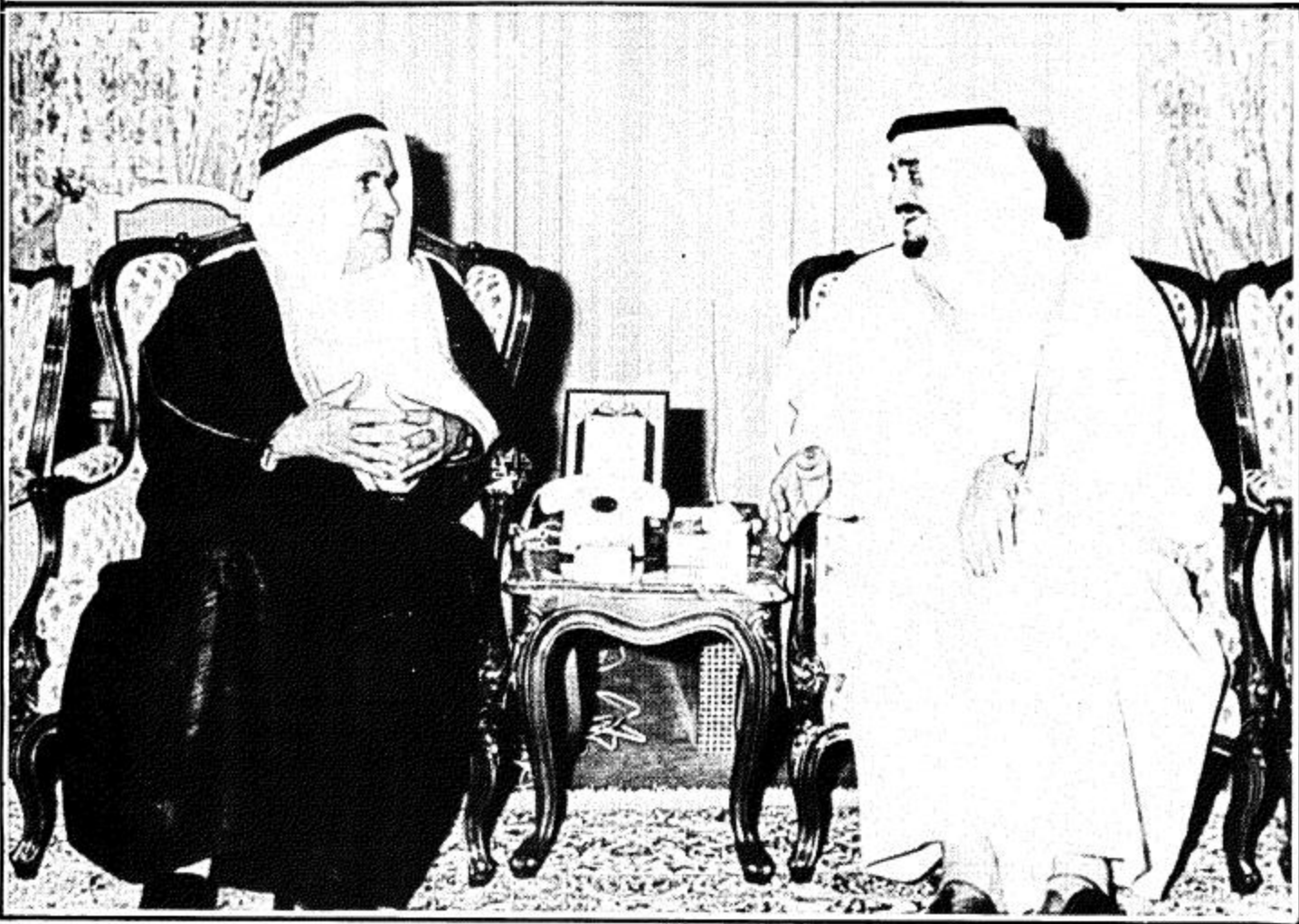
جلالة الملك المفدى يستقبل سفير الإمارات