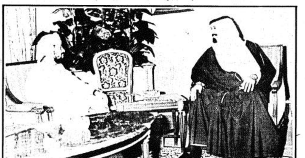
سمو ولي العهد يستقبل السفير العماني