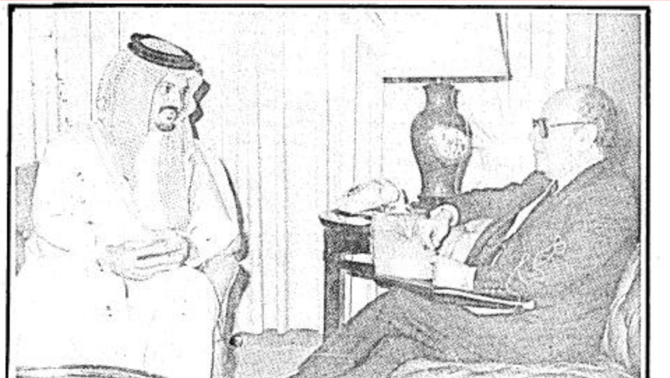
سمو وزير الخارجية يجتمع مع الامين العام لمنظمة المؤتمر الاسلامي

الرياض - واس اجتمع صاحب السمو الملكي الامير سعود الفيصل وزير الخارجية في مكتب سموه صباح أمس مع الامين العام لمنظمة المؤتمر الاسلامي السيد الحسين الشطي. وقد ادلى سمو وزير الخارجية بتصريحات لوكالة الأنباء السعودية اوضح فيه انه تم خلال الاجتماع استعراض عدد من الموضوعات التي سيبحثها مجمع الفقه الاسلامي خلال اول اجتماع له في الفترة القريبة القادمة مشيراً الى ان هذا المجمع من