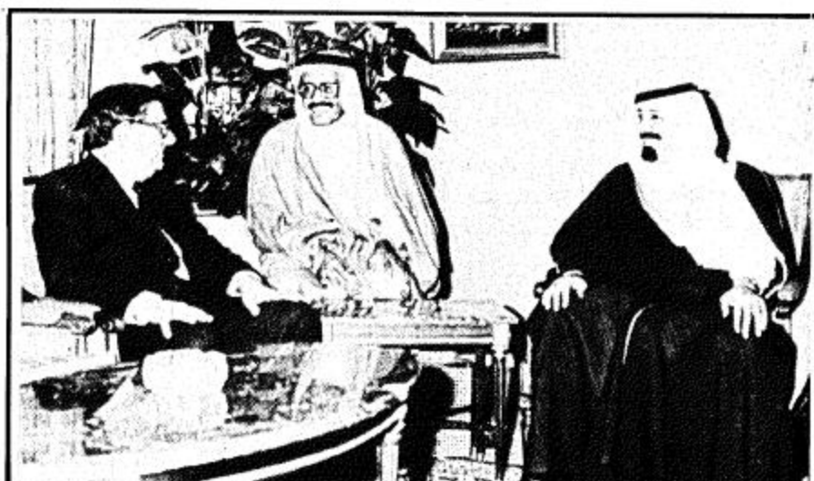
سمو ولي العهد يستقبل السفير الباكستاني