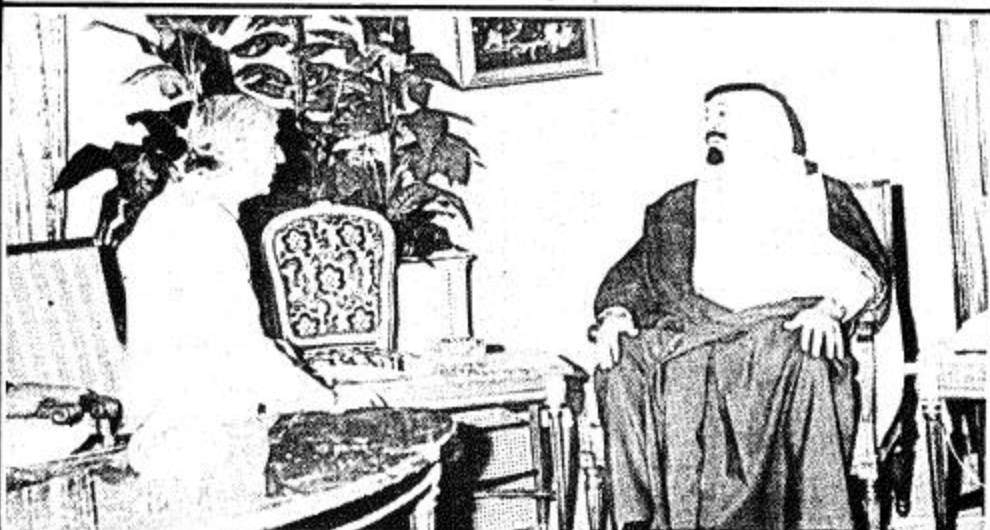
سمو ولي العهد يستقبل السفير البريطاني