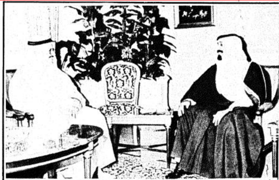
سمو ولي العهد يستقبل السفير الكويتي