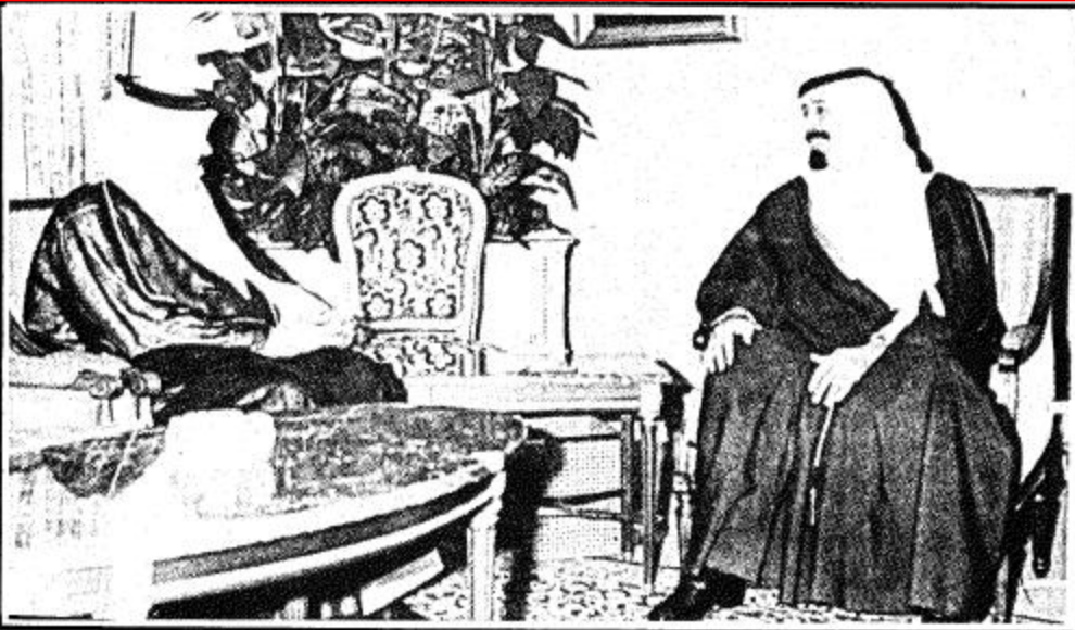
سمو ولي العهد يستقبل السفير العماني

استقبل جلالته الملك فهد بن عبد العزيز المفدى بمكتبه أمس سفير دولة الإمارات العربية المتحدة لدى المملكة محمد احمد ابو رحيمة.