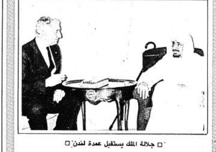
جلالة الملك يستقبل عمدة لندن