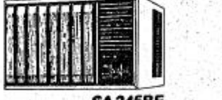
SA 245BE ٢٤٥٠٠ في في في ساعة تبريد - ساعة تدفئة