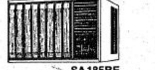
SA 185BE ١٨٥٠٠ في في في ساعة تبريد - ساعة تدفئة