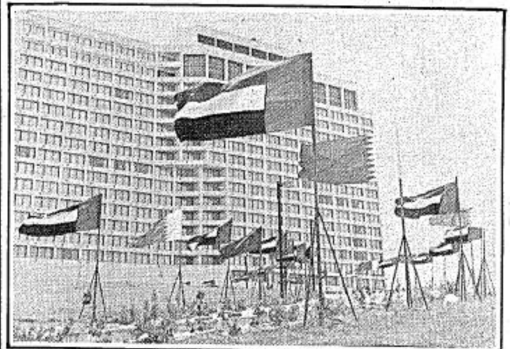
المبنى الذي سيجعل فيه اول اجتماع قمة خليجي جدول اعمال مؤتمر القمة الاول لرؤساء دول الخليج الست.

دول مجلس التعاون الخليجي على جدول اعمال مؤتمر القمة الاول لرؤساء دول الخليج الست. ويبلغ ارسال هيئة الاستثمار ستة بلايين دولار.