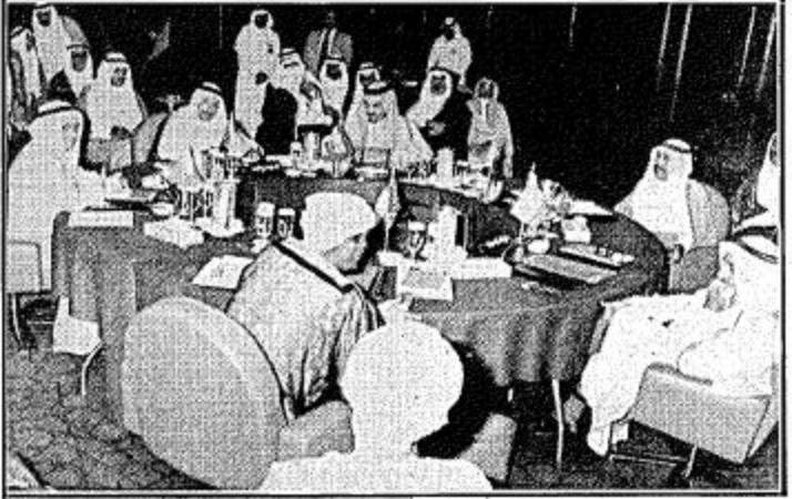
الجلسة الافتتاحية لوزراء خارجية دول مجلس التعاون الخليجي

مرحباً به في مطار الخرطوم.. النميري: السادات بطل السلام وبطل العرب! حشدت الحكومة مئلات من السودانيين للترحيب بالرئيس المصري انور السادات الذي يطأ ارضا عربية لأول مرة عدا مصر منذ توقيع المعاهدة المصرية الاسرائيلية. وصفته المصارف الاعلامية المصرية بأنه استقبال الابطال. بينما دعت الحكومة السورية على لسان متحدى بوزارة الخارجية فيها الدول العربية الى اتخاذ اجراءات ضد حكومة السودان بما وصفته بالحقائق على المصالح العربية العليا. وقال المتحدث ان الحكومة السورية قررت عدم ارسال سفير لها الى الخرطوم كما قررت الطلب الى الامم المتحدة لاجتماعها بين النظامين السوداني والمصري على جدول اعمال اول اجتماع للجامعة العربية لاتخاذ الاجراءات المناسبة ضد الحكومة السودانية. كما دعت الحكومة السورية بهذه المناسبة جميع الدول العربية لاتخاذ اجراءات ضد حكومة السودان للحفظ