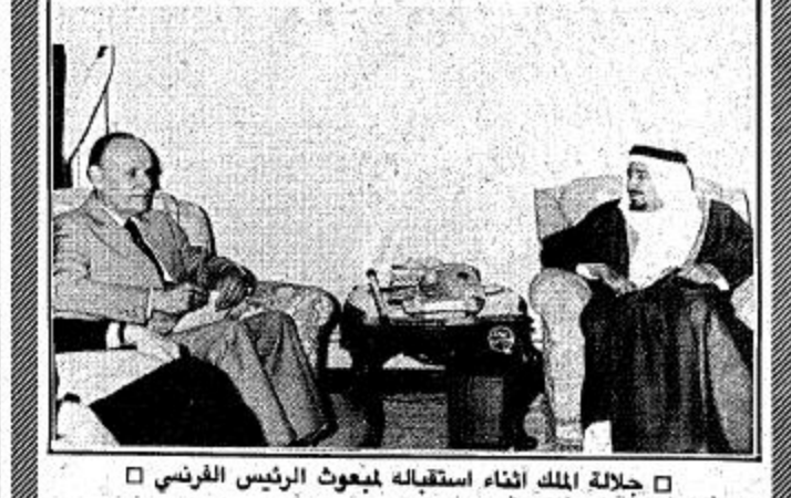
جلالة الملك أثناء استقباله لمبعوث الرئيس الفرنسي

بعد مقيلته لجلالة الملك المعظم اعرب اول مبعوث فرنسي يوفده الرئيس فرانسوا ميتران للمنطقة عن امله في الا يحصل اي تغيير على العلاقات الجيدة بين المملكة وفرنسا... وكانت (واس) قد اوردت امس ان جلالة الملك خالد استقبل في الساعة السابعة والنصف من مساء امس الجنرال جاك ميتران مبعوث الرئيس الفرنسي فرانسوا ميتران الذي سلم لجلالته رسالة من الرئيس الفرنسي. البيعة ص ٢٦