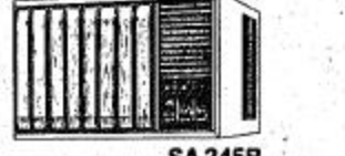
SA 245B ٢٤٥٠٠ في في في ساعة تبريد - ساعة تدفئة