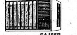
SA 185B ١٨٥٠٠ في في في ساعة تبريد - ساعة تدفئة