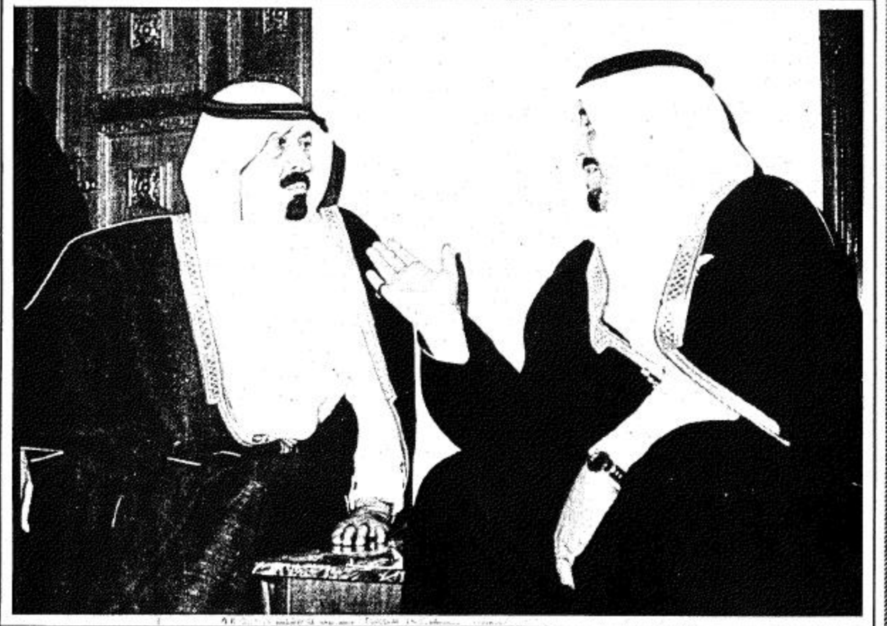
● حديث متبادل بين العهد والامير عبدالله ●

احتفاء باصحاب الجلالة والسمو امراء ورؤساء دول مجلس التعاون لدول الخليج العربية. اقام جلالة الملك خالد بن عبد العزيز المفدى مساء امس حفل عشاء بقصر جلالته بالمعذر. وقد حضر الحفل جلالة السلطان قابوس بن سعيد سلطان عمان وسمو الشيخ عيسى بن سلمان آل خليفة امير دولة البحرين وسمو الشيخ خليفة بن حمد آل ثاني امير دولة قطر وسمو الشيخ زايد بن سلطان آل نهيان رئيس دولة الامارات العربية المتحدة وسمو الشيخ جابر الاحمد الصباح امير