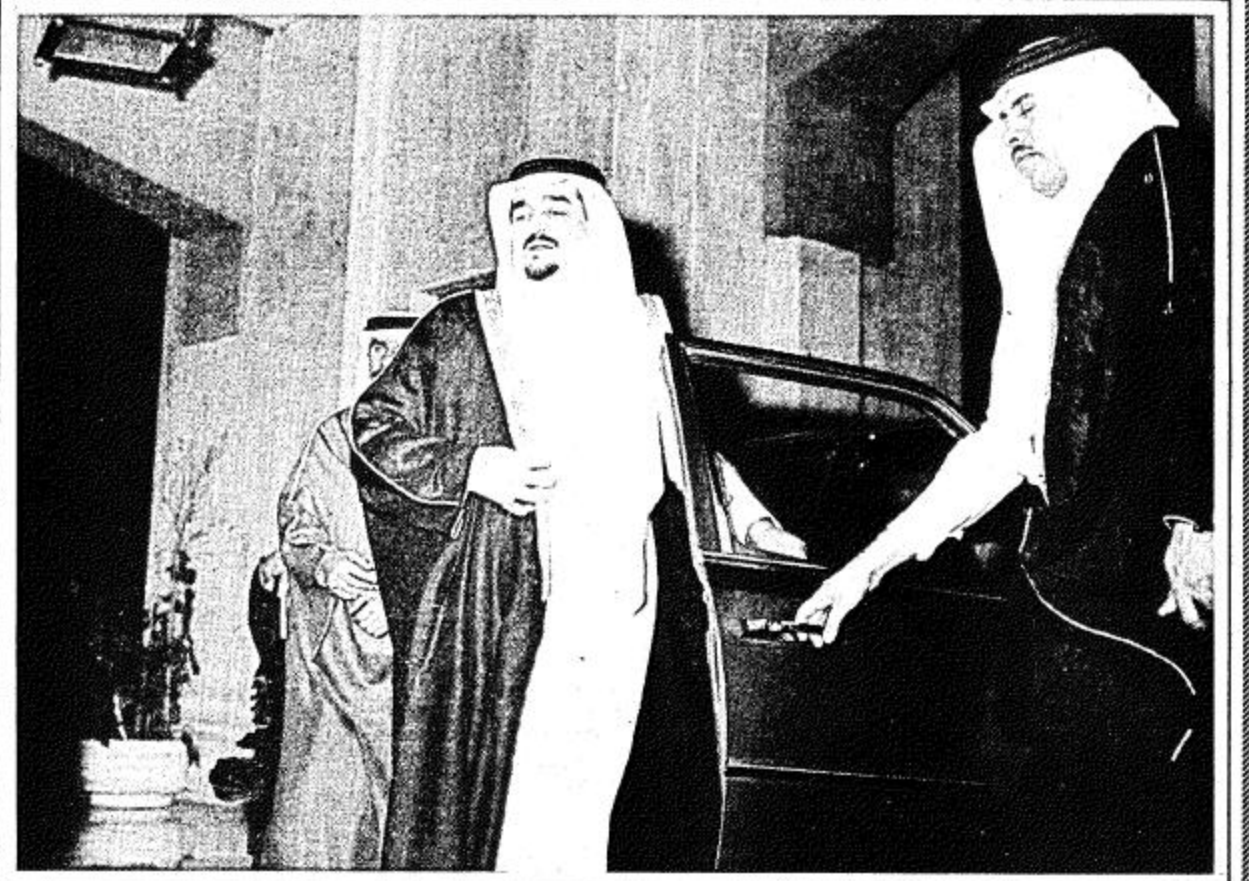
● سمو الامير فهد لدي وصوله الى قصر جلالة الملك لحضور حفل العشاء ●