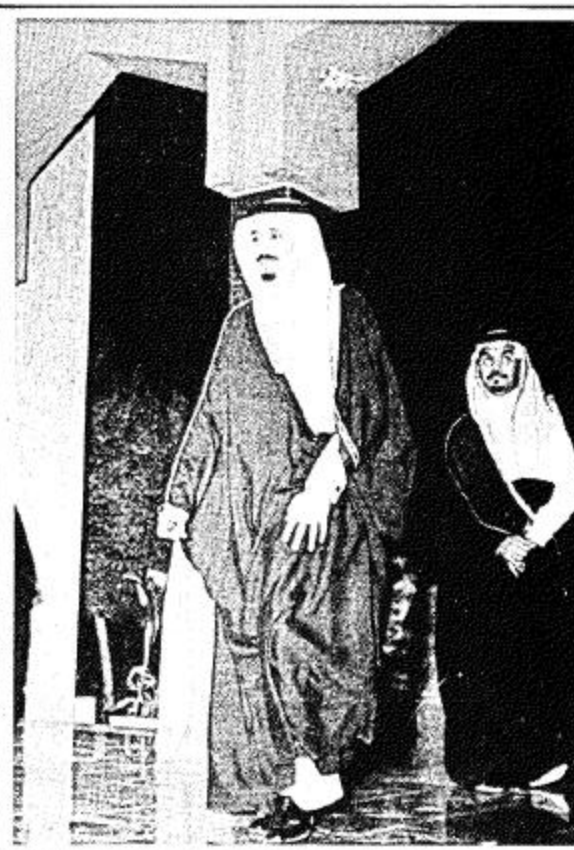
● سمو الامير سلمان متوجها الى قاعة الاستقبال لاستقبال الضيوف ●