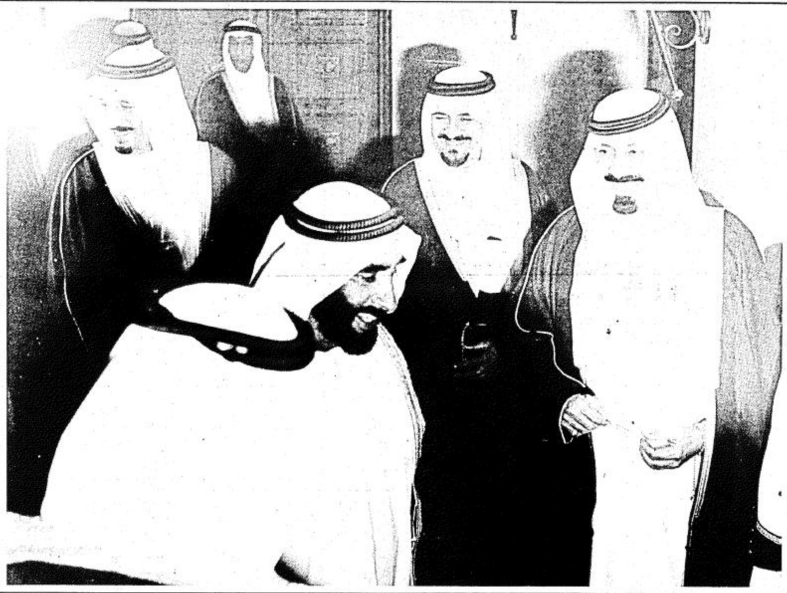
● الشيخ زايد وحديث باسم مع اصحاب السمو الملكي الامراء ●