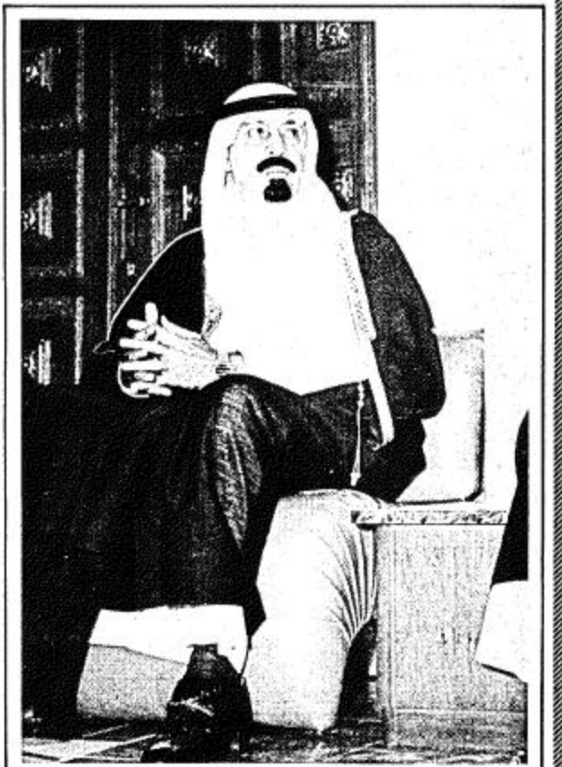
● سمو الامير عبدالله في الحفل ●