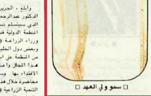
سمو ولي العهد

الرياض - واس - اعرب جلالة الملك فهد بن عبدالعزيز القدي عن شكره وتقديره لصاحب السمو الملكي الامير فيصل بن فهد بن عبدالعزيز الرئيس العام لرعاية الشباب ورئيس اللجنة العليا للبطولة الآسيوية الثانية للشباب في الكرة الطائرة وكافة الاعضاء والمشاركين في البطولة للجهود الطيبة التي بذلها في سبيل التعاون لإنجاح البطولة الآسيوية الثانية للشباب في الكرة الطائرة وإقامة حفلها بالرياض جاء ذلك في برقية تلقاها سمو الامير فيصل بن فهد بن عبدالعزيز من جلالة الملك القدي ردا على البرقية التي كان قد بعثها سموه لجلالته بهذه المناسبة كما اعرب جلالته و برقيته عن اعفه في ان يحالف المشاركين في البطولة التوفيق والنجاح لتحقيق الاهداف المرجوة منها كما اعرب صاحب السمو الملكي الامير عبدالله بن عبدالعزيز وولي العهد نائب رئيس مجلس الوزراء ورئيس الحرس الوطني في برقية مماثلة تلقاها سمو الرئيس العام لرعاية الشباب عن شكره وتقديره لسمو وجميع المشاركين في البطولة لما قاموا به من جهود طيبة لإنجاح البطولة وإنجاحها وتلقى سمو الامير عبدالله بن عبدالعزيز لسمو الامير فيصل بن فهد بن عبدالعزيز وللمشاركين التوفيق والنجاح لرفع مستوى الرياضة وتحقيق الاهداف المرجوة منها