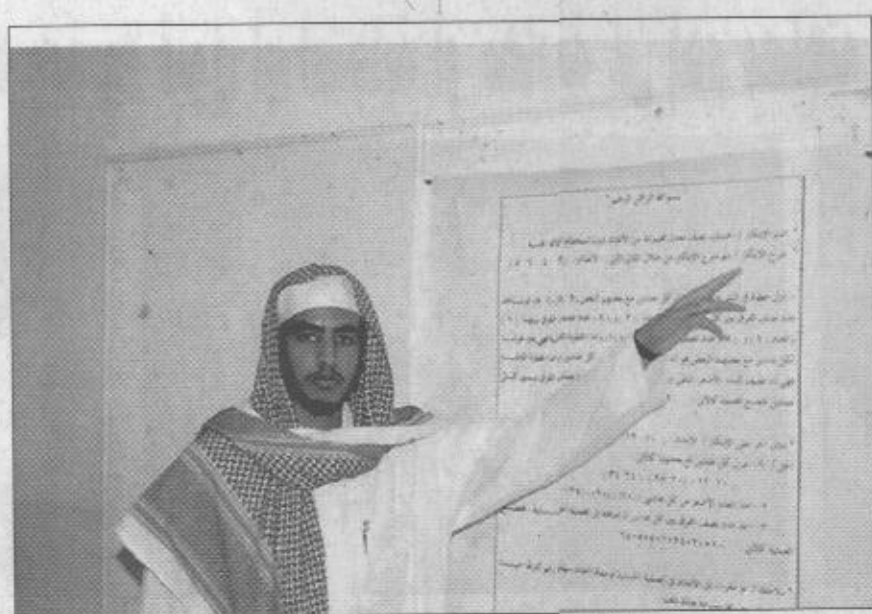
الطالب الموهوب في الرياضيات يشرح نظريته