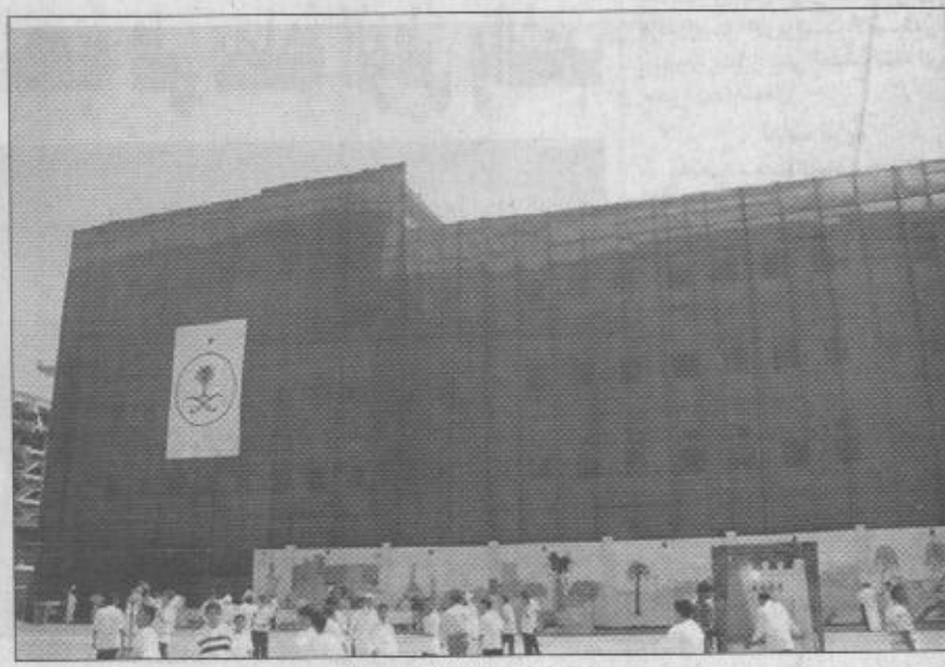
مشروع مركز رعاية الموهوبين