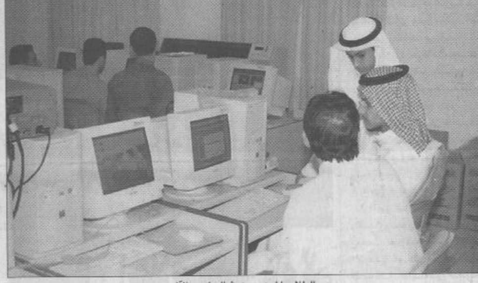
الطلاب الموهوبون في الحاسب الآلي