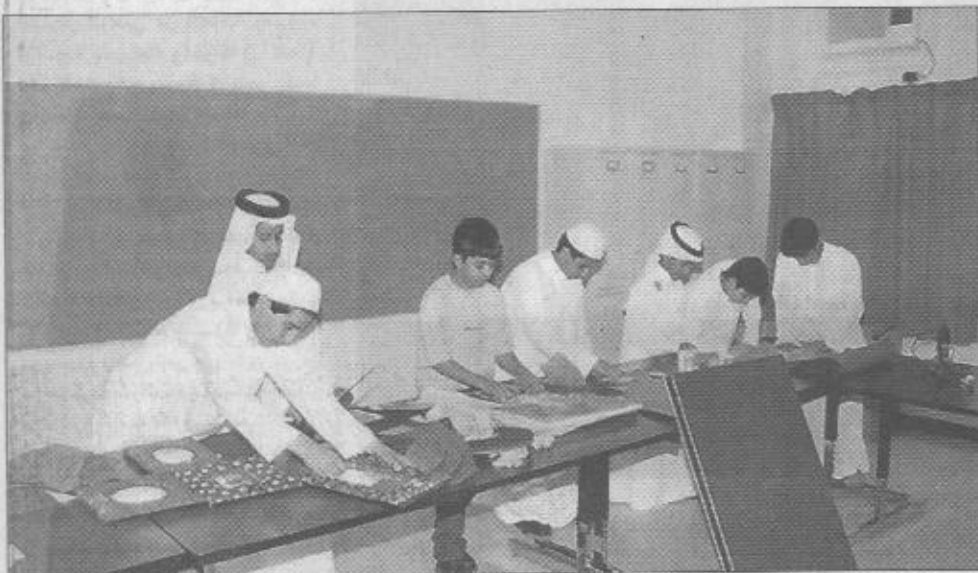
عدد من الطلبة الموهوبين بالترقية الفنية