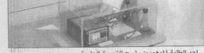
أحد الطلبة الموهوبين يشرح التجربة العلمية

كما عقدت لجنة رعاية الموهوبين بالمنطقة الشرقية والتي تعتبر فرعاً لمؤسسة الملك عبدالعزيز ورجاله لرعاية الموهوبين بالمنطقة الشرقية اجتماعاً آخر تم خلاله الاطلاع على اوراق العمل التي تم اعدادها من قبل اعضاء اللجنة وعقدت دورات تدريبية للعاملين بالمركز واعداد الندوات والمحاضرات لتوعية الاباء والمجتمع المدرسي والمحلي وتقنية برنامج الطلبة الموهوبين والترتيب للقاء اعضاء اللجنة مع رئيس البرنامج والمشرف العلمي لبرنامج الكشف عن الموهوبين ورعايتهم وزملائه الكرام.