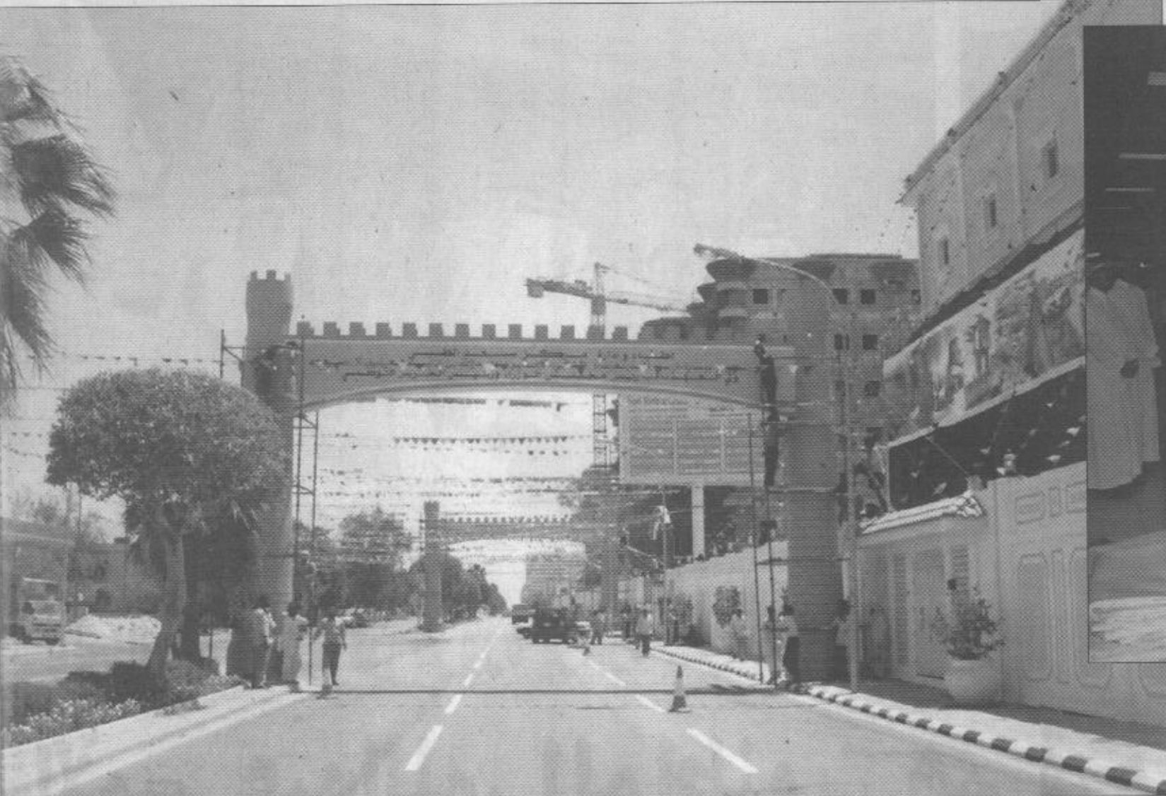
مدخل مركز رعاية الموهوبين