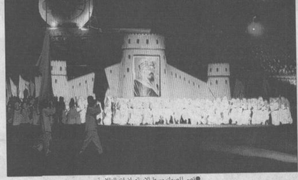
تصوير المصمم وسط الاستعراضات الطلابية