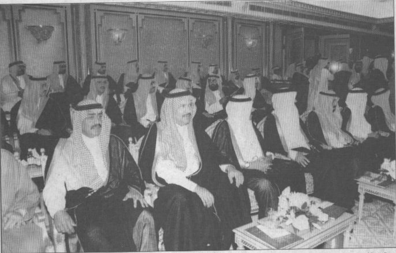
جانب من اصحاب سمو الملكي الأمراء