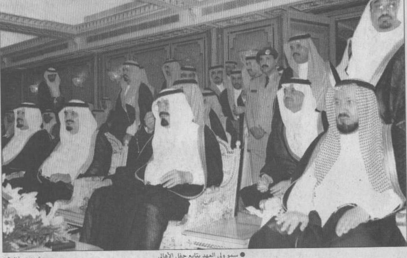
سمو ولي العهد يتابع حفل الأهلالي