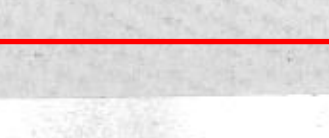
جانب من اصحاب سمو الملكي الأمراء