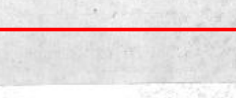
قصات شعبية تصاحب الأوبريت