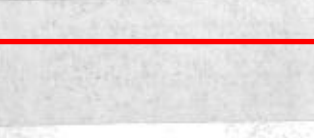
قصات شعبية تصاحب الأوبريت

بعدما بدأت الألعاب النارية التي غطت سماء الراكبة بالوان واشكال جميلة شددت اهتمام الحضور داخل المعبد وخارجه.