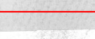
جانب من اصحاب سمو الملكي الأمراء