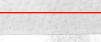
جانب من الأوبريت الاستعراضي