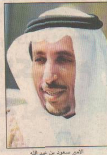
الامير سعود بن عبد الله