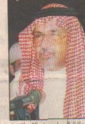
محافظ الجيبيل سيف القحطاني