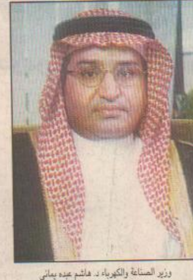
وزير الصناعة والكهرباء، هاشم عبد يماني

تتشرف المنطقة الشرقية هذه الايام بزيارة صاحب السمو الملكي الامير عبدالله بن عبدالعزيز ولي العهد نائب رئيس مجلس الوزراء ورئيس الحرس الوطني حيث يريعى سموه اليوم عددا من الفعاليات في مدينة الجيبيل الصناعية بوضع حجر الأساس لمشاريع توسعة مجمعي شرق وكيمياء ويدشن مشاريع توسعة سافكو والرازي وافتتاح كلية التربية للبنات بالجيبيل الصناعية.