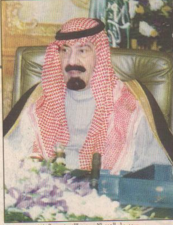
سمو ولي العهد الامير عبد الله بن عبد العزيز

سمو رئيس الهيئة الملكية بالإنابة لهـ اليوم