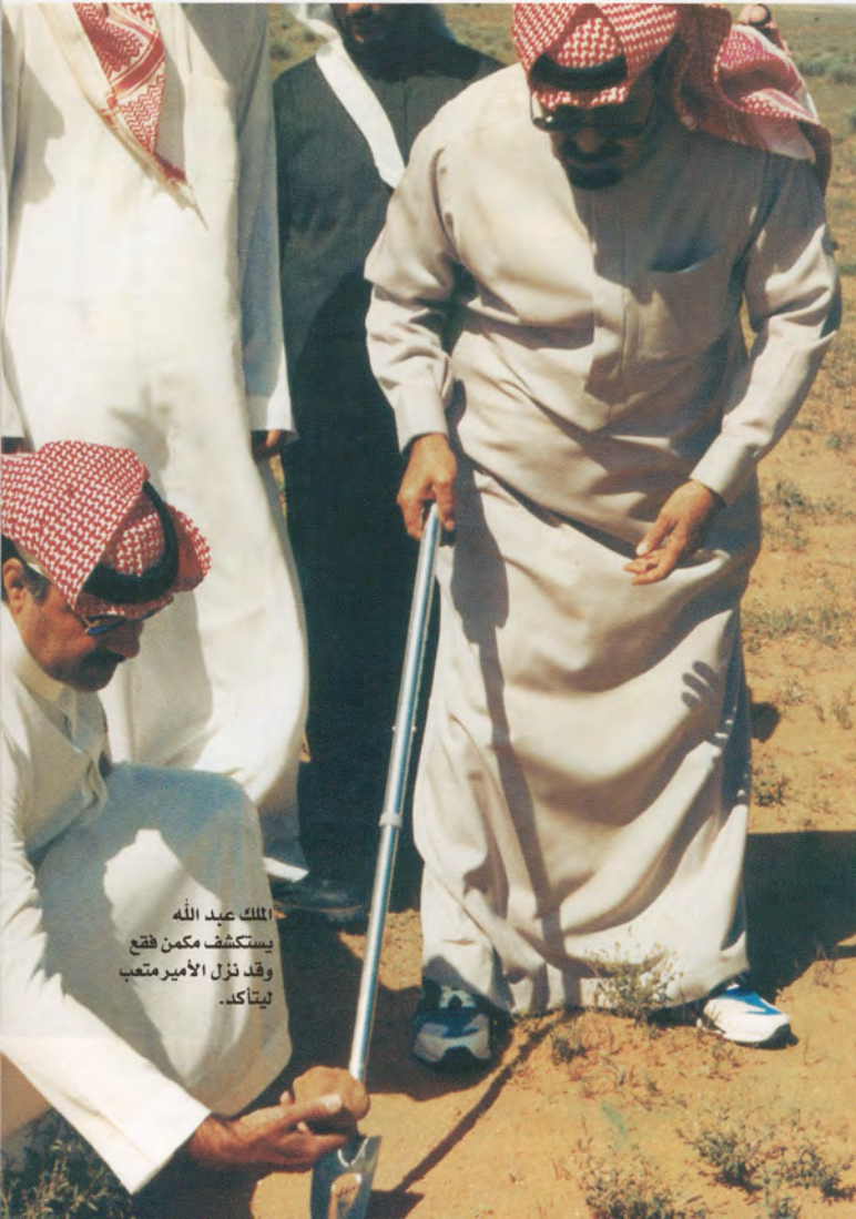
الملك عبد الله يستكشف مكنن فقع وقد نزل الأمير متعب ليتأكد.

يوصل الأمير متعب بن عبدالله الحديث عن والده ولكن هذه المرة في برنامجه إذا خرج إلى البر فيقول: برنامج خادم الحرمين الشريفين في البر يختلف عنه عندما نكون في المدن، فهو يحدد مكان المضحي منذ الليل، وبعد تناول الإفطار بعد الفجر يبدأ هواة المشي من المرافقين سيرهم على الإقدام، وهو من هواة الدائمين حيث يسير يومياً مسافة تزيد عن ثلاثة كيلوات ومعه مجموعة، وأثناء السير لا يخلو الأمر من حديث عن عشية أو نبته برية فليديه معلومات واسعة في هذا المجال، أو أن نبحت عن الفقع في أيام الربيع، ولا يخلو حديث في مجلس أثناء البر أو غيره عن الملك عبدالعزيز غفر الله له، وفي الليل نلتهم أمام التلفزيون حيث نتناول العشاء في البر حيث يحرض على سماع نشرة الأخبار، ثم يأخذ وقتاً طويلاً للإنتهاء من بعض