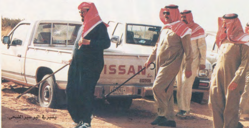
يسير في البر سير المضحي.

وإذا بي أراه يستعد للخروج.. وبالفعل خرجنا وتجولنا في الرياض ولا أخفيك كنت أشعر بالحرج، حيث كنا نقف عند الإشارات المرورية فيشاهدنا الناس، وبعضهم يتقدم برأسه ويمده