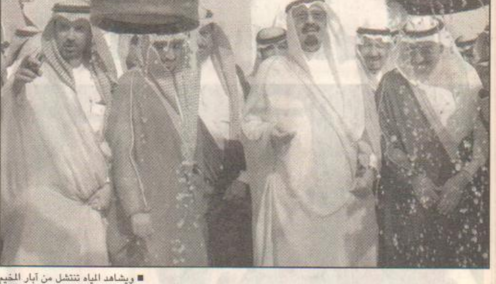
ويشاهد المياه تنشل من ابار المخيم