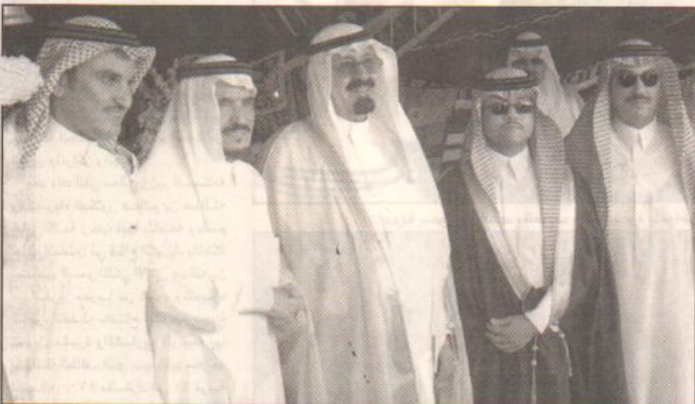
سمو ولي العهد يشرف حفل غداء الشيخ سلطان بن جهجاه العتيبي