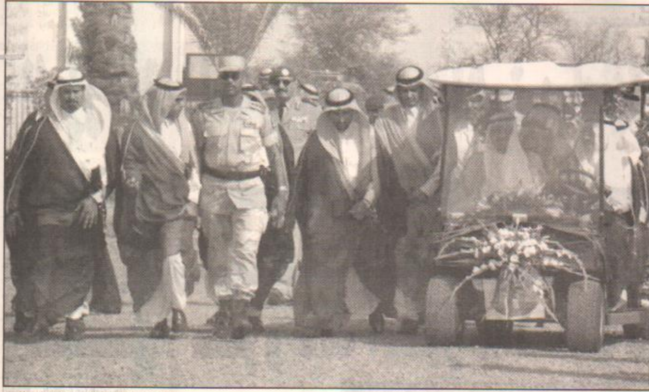
سموه يستقل عربة في جولته داخل المتنزه