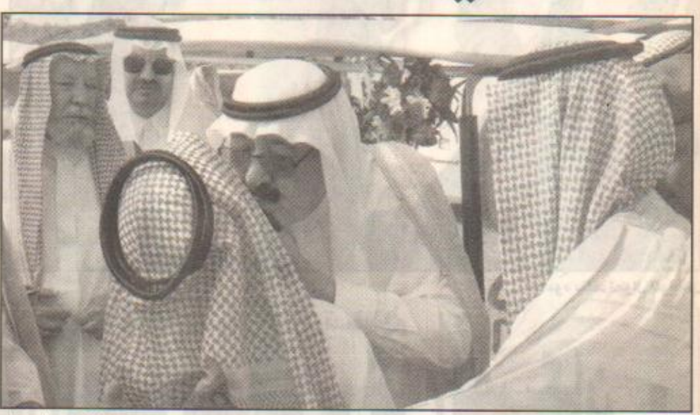
سموه يقبل تظلا كان في استقباله