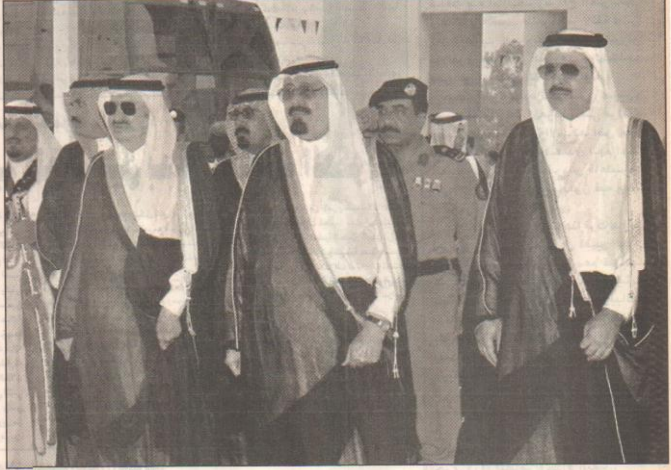
انشطة سمو ولي العهد بالطائف وافتتاحه عددا من المشروعات التنموية