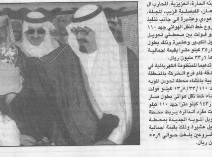
سموه يتلقى هدية تذكارية