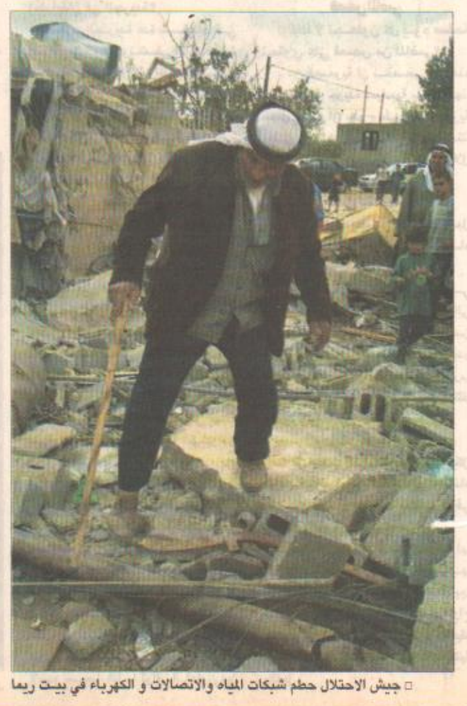
جيش الاحتلال حطم شبكات المياه والاتصالات والكهرباء في بيت ربما

اقرأ في الداخل شياطان في علب ملونة مجنون يشوش مثقفي العالم.. بالسريالية تكريم معلم بالضرب في الأحساء