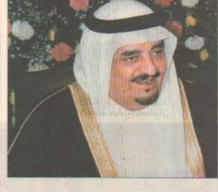
وقد أعرب خادم الحرمين الشريفين باسمه وباسم شعب وحكومة المملكة عن أبلغ التهاني مقرونة بتمنيات الصحة والسعادة لفخامته والأزدهار الدائم لشعب النمسا الصديق.

خادم الحرمين الشريفين يهنئ رئيس النمسا الرياض / واس بعث خادم الحرمين الشريفين الملك فهد بن عبدالعزيز آل سعود برقية تهنئة إلى فخامة الرئيس الدكتور توماس كليستيل الرئيس الاتحادي لجمهورية النمسا بمناسبة ذكرى الاستقلال. وقد أعرب خادم الحرمين الشريفين باسمه وباسم شعب وحكومة المملكة عن أبلغ التهاني مقرونة بتمنيات الصحة والسعادة لفخامته والأزدهار الدائم لشعب النمسا الصديق.