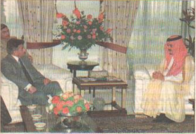
الرئيس الباكستاني يستقبل الأمير سعود الفيصل

رسالة من خادم الحرمين الشريفين وولي العهد للرئيس الباكستاني مشرف يعبر عن شكره لدعم الملكة بلالاه ويتطلع لزيد من التعاون اسلام آباد / واس بعث خادم الحرمين الشريفين الملك فهد بن عبدالعزيز آل سعود وصاحب السمو الملكي الأمير عبدالله بن عبدالعزيز ولي العهد نائب رئيس مجلس الوزراء رئيس الحرس الوطني رسالة إلى فخامة الرئيس برويز مشرف رئيس جمهورية باكستان الإسلامية. ونقل الرسالة صاحب السمو الملكي الأمير سعود الفيصل وزير الخارجية خلال اجتماعه في اسلام آباد أمس مع الرئيس مشرف بحضور وزير خارجية باكستان عبدالستار وسفير المملكة لدى باكستان علي عواض عسيري. وأعاد بيان باكستاني رسمي أن الرئيس الباكستاني عبر عن شكره وتقديره لخادم الحرمين الشريفين وسمو ولي العهد للسمو الذي تقدمه الملكة بلالاه وعبر عن تطلعه إلى مزيد من التعاون الثنائي على كافة المجالات وأشار البيان إلى أن سمو الأمير سعود الفيصل أبدى تضامناً للملكة مع باكستان في مواجهة التحديات الحالية. وأوضح سمو وزير الخارجية أن الرسالة التي قام بنقلها هي رسالة صداقة وتضامن مع قيادة شعب باكستان وذكر سموه في تصريحات صحفية ألبس بها في اسلام آباد