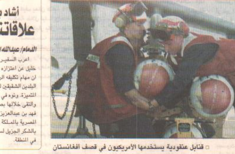
قنابل عنقودية يستخدمها الأمريكيون في قصف افغانستان

أمريكا تعترف باستخدام القنابل الانشطارية وتعلن: ابن لادن هدف صعب المنال كابول، واشنطن / وكالات الأنباء قصف الطيران الامريكى ٢٦ مرة امس مواقع حركة طالبان الحاكمة في أفغانستان بالقرب من مدينة مزار الشريف الاستراتيجية في شمال أفغانستان واستأنف أيضا قصفه الشديد للعاصمة كابول، حسبما أوردت وكالة الأنباء الإسلامية الافغانية التي تتخذ من باكستان مقرا في الوقت الذي اعترفت فيه الولايات المتحدة الأمريكية بانها تستخدم القنابل الانشطارية التي تودي بحياة أكبر عدد من الناس في منطقة وقوعها. ما دفع منظمات انسانية ومن بينها الصليب الاحمر إلى مطالبة أطراف النزاع إلى الاعتذار لاسبط