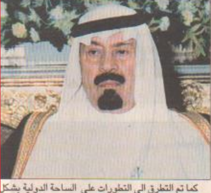
كما تم التطرق إلى التطورات على الساحة الدولية بشكر عام ومجريات الاحداث في افغانستان ومجمل العلاقات بين البلدين.

تلقي اتصالاً هاتفياً من الرئيس بوش الأمير عبد الله ينبه لانتهاك إسرائيل الصارخ للمواثيق الدولية وعدوانها الغاشم على الشعب الفلسطيني الرياض / واس تلقي صاحب السمو الملكي الأمير عبدالله بن عبدالعزيز ولي العهد نائب رئيس مجلس الوزراء رئيس الحرس الوطني اتصالاً هاتفياً أمس من فخامة الرئيس الامريكى جورج دبليو بوش تطرق فيه سموه إلى التطورات الاخيرة في المنطقة وتساءل عن الاحداث في الاراضي الفلسطينية المحتلة وما يحدث من انتهاكات صارخة للاعراف والمواثيق والقيم الدولية وسقوط يومي لشحايا الفلسطينيين جراء العنف والتسلط الاسرائيلي وعدوان الغاشم على شعب اعزل.