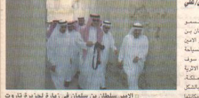
الأمير سلطان بن سلمان في زيارة لجزيرة تاروت بالتعاون مع القطاع الخاص.. شديدا بدور الهيئة الملكية للجزيرة ومطعم تاروت أنها غنية بالأثار والتاريخ وسوف تعمد في خطة هيئة السياحة لتطويرها.

شدد على أهمية (تاروت) أنربيا.. الأمير سلطان بن سلمان: مشاريع سياحية مع القطاع الخاص.. قريبا الدمام / اليوم / الجليل / علي شهاب صرح صاحب السمو الملكي الأمير سلطان بن سلمان بن عبدالعزيز الأمين العام للهيئة العليا للسياحة بأن جزيرة تاروت سوف تكون من أهم الاماكن الأثرية التي ستكون في المنطقة وسيتم الاهتمام بها بالشكل الذي يجعلها تستحق مكانتها الطبيعية في تاريخ البلاد. وقال سموه أثناء تجوله في الجزيرة ومطعم تاروت أنها غنية بالأثار والتاريخ وسوف تعمد في خطة هيئة السياحة لتطويرها. من جهة اخرى أكد سموه ان الجبلين من أهم المحافظات التي تستقطب السياح في مختلف أنحاء المملكة ودول الخليج وهي الآن مهية للاستثمار السياحي بعد الصناعات وأضاف في حفل الاستقبال الذي أقيم لسموه بالهيئة الملكية ان هناك الكثير من المشاريع المزمع اقامتها