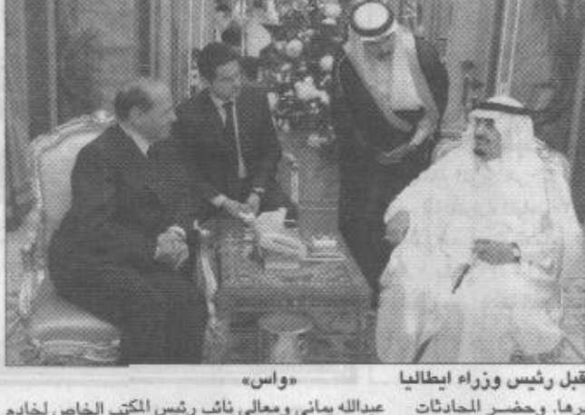
الملك فهد بن عبدالعزيز آل سعود ورئيس وزراء إيطاليا رومانو بروفدي يتناولان العشاء في قصر الملك فهد بن عبدالعزيز في الرياض.