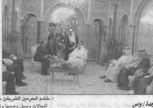
الملك فهد بن عبدالعزيز آل سعود ورئيس وزراء إيطاليا رومانو بروفدي يتناولان العشاء في قصر الملك فهد بن عبدالعزيز في الرياض.

الملك فهد بن عبدالعزيز آل سعود ورئيس وزراء إيطاليا رومانو بروفدي، استقبلوا خادم الحرمين الشريفين في قصر الملك فهد بن عبدالعزيز في الرياض، وذلك في إطار زيارته الأولى للسعودية. وتناول اللقاء، الذي استمر لمدة ساعتين، العديد من القضايا، منها التطور الاقتصادي في إيطاليا، والتعاون في مختلف المجالات، بالإضافة إلى مناقشة الأوضاع في الشرق الأوسط، وخاصة القضية الفلسطينية، والتحديات التي تواجهها. وأعرب الطرفان عن تقديرهما للتعاون القائم بين البلدين، واتفقا على تعزيز هذا التعاون في المستقبل.