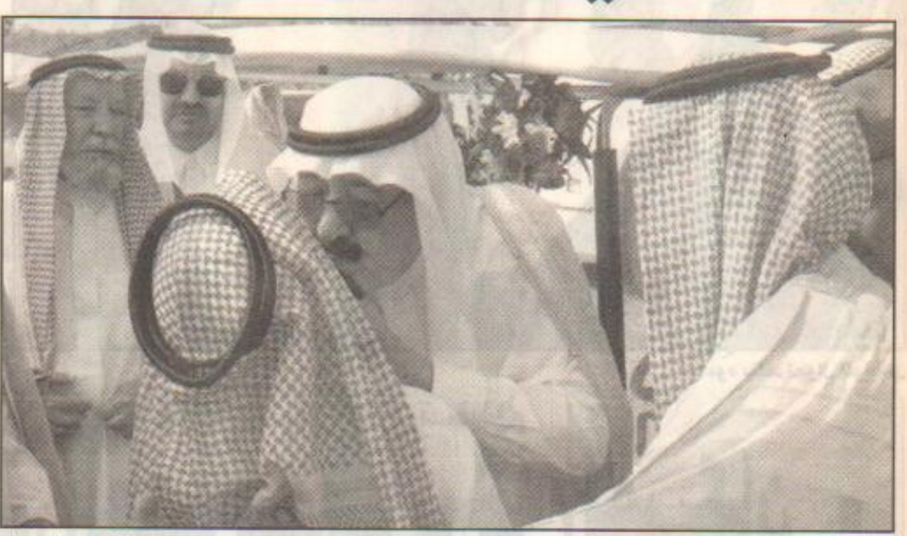
سموه يقبل تظلاً كان في استقباله