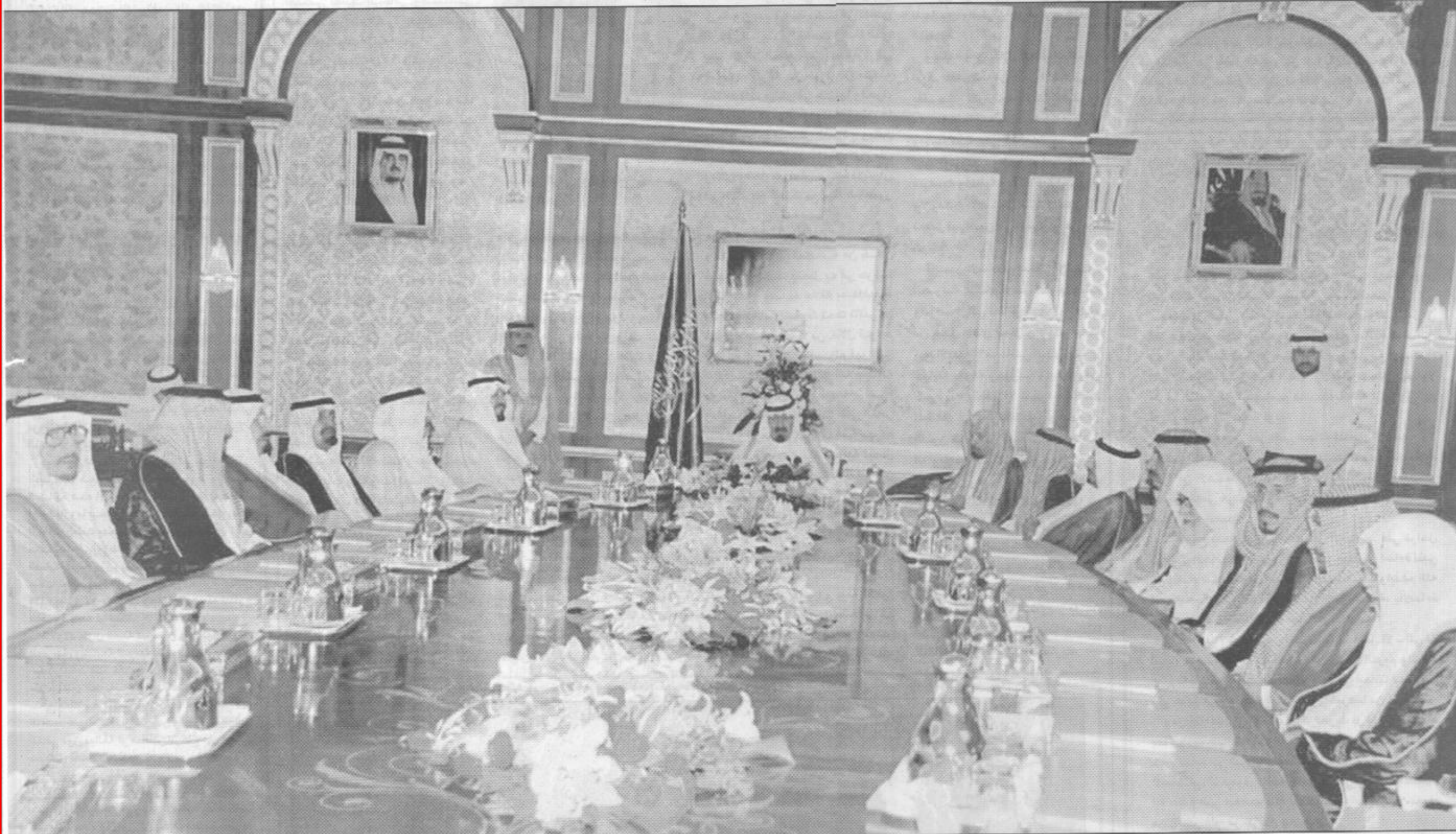
■ سمو ولي العهد يرأس الجلسة الأولى لاجتماع مجلس العائلة