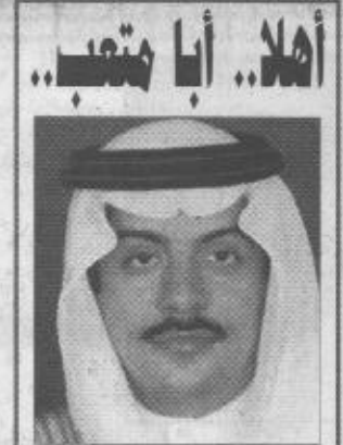
أهلا.. أبا متعب..

يقلم ب. صالح عبدالهادي البقشي * جاء في صديق والفرحة بادية على محياه - فسألته ما بالك فرحا منسورا؟ قال لي وكيف لا وأنا اسمع خطاب سمو ولي العهد وهو لفرحني كمواظن نكتسي عيني به يفرح لفرحني ويشاركني هسي ويأخذ بيدي لاكون شريكا فاعلا في بناء الوطن وقامت في في الفعالة في بناء ماذا ففهم من خطابه؟