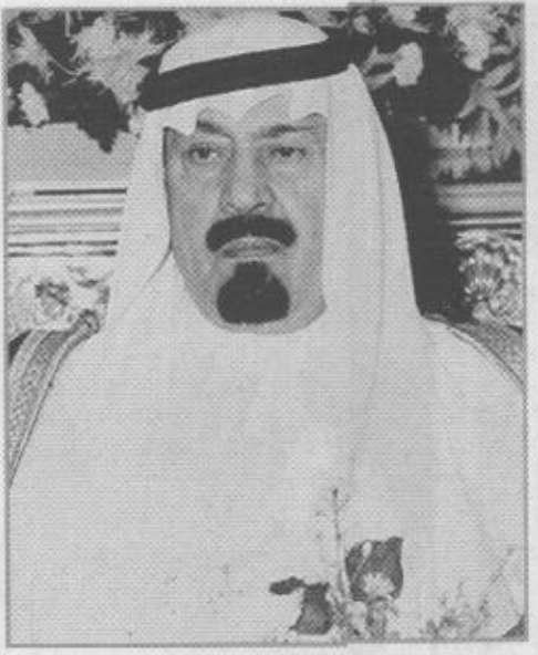
الأمير سعود بن عبدالعزيز