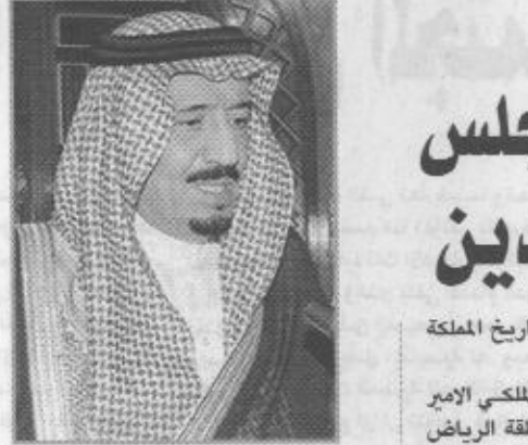
سمو الامير سلمان بن عبد العزيز

وجه صاحب السمو الملكي الأمير عبدالله بن عبدالعزيز ولي العهد ونائب رئيس مجلس الوزراء ورئيس الحرس الوطني بريقة جوازية الى معالي وزير الشؤون الإسلامية والأوقاف والدعوة والإرشاد الشيخ صالح بن عبدالعزيز بن محمد آل الشيخ ردا على البرقية المرفوعة من معاليه بمناسبة انتهاء أعمال المسابقة السنوية الدولية الحادية والعشرين لحفظ القرآن الكريم وتجويده وتفسيره بمكة المكرمة.. وقد أعرب سموه عن تقديره لما تضمنته البرقية من مشاعر. وأكد سموه ان المملكة التي شرفها الله باحتواء الحرمين الشريفين لن تدخر وسعا في بذل أقصى الجهود التي من شأنها نشر الاسلام في اصقاع المعمورة بما في ذلك تشجيع الناشئة على حفظ كتاب الله وتلاوته وتجويده على الوجه المطلوب. وسأل الله تعالى ان يوفق الجميع لخدمة دينه واعلاء