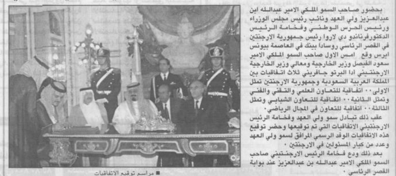
مراسم توقيع الاتفاقيات

يحضر صاحب السمو الملكي الأمير عبدالله بن عبدالعزيز ولي العهد ونائب رئيس مجلس الوزراء ورئيس الحرس الوطني وفخامة الرئيس الدكتور فرناندو دي لاروا رئيس جمهورية الأرجنتين في القصر الرئاسي روسادا بينك في العاصمة بيونس آيرس وقع أمس الأول صاحب السمو الملكي الأمير سعود الفيصل وزير الخارجية ومعالي وزير الخارجية الأرجنتيني ادا البرتو جافريني ثلاث اتفاقيات تمثل المملكة العربية السعودية وجمهورية الأرجنتين تمثل الأولى اتفاقية للتعاون العلمي والتقني والفني والثانية اتفاقية للتعاون الشبابي وتمثل الثالثة اتفاقية للتعاون في المجال الرياضي. عقب ذلك تبادل سمو ولي العهد وفخامة الرئيس الأرجنتيني الاتفاقيات التي تم توقيعها وحضر توقيع هذه الاتفاقيات الوفد الرسمي المرافق لسمو ولي العهد وعدد من كبار المسؤولين في الأرجنتين. بعد ذلك ودع فخامة الرئيس الأرجنتيني صاحب السمو الملكي الأمير عبدالله بن عبدالعزيز عند بوابة القصر الرئاسي.