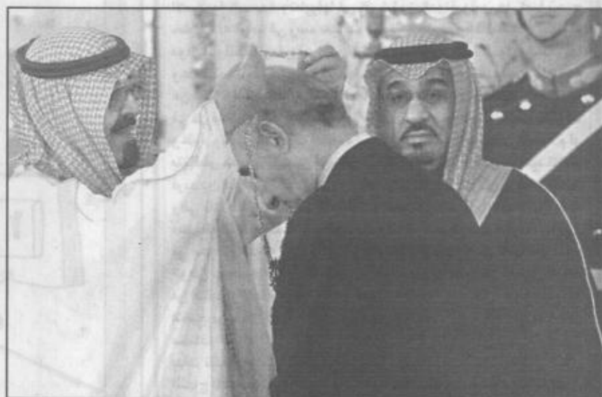
سمو ولي العهد يقبل الرئيس الأرجنتيني وسام الملك عبدالعزيز