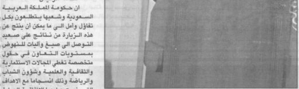
الرئيس الأرجنتيني لدى القائه كلمة في حفل العشاء

تستغل عملية السلام لتقويم علاقاتها مع أعضاء المجتمع الدولي بما في ذلك الأرجنتين دون التقييد بمبادئ هذه العملية خاصة مبدأ الأرض مقابل السلام أو الوفاء بتعهداتها والتزاماتها مع أطراف التفاوض على مختلف مساراته. وعليه فإننا نأمل من حكومة الأرجنتين توظيف علاقاتها مع إسرائيل في الاتجاه الذي يخدم عملية السلام ويسهم في دفعها من أجل تحقيق الأمن والاستقرار لكافة شعوب الشرق الأوسط. قخامة الرئيس: ان حكومة المملكة العربية السعودية وشعبها يتطلعون بكل تفاؤل وأمل إلى ما يمكن أن ينتج عن هذه الزيارة من نتائج على صعيد التواصل إلى صيغ والنيات للشهود بمستويات التعاون في حقول متخصصة تغطي المجالات الاقتصادية والثقافية والعلمية وشؤون الشباب والرياضة وذلك استجابة مع الأهداف التي نصت عليها الاتفاقية العامة المعقودة بين البلدين. وانني على يقين ان شاء الله من حرص فخامتكم على بذل كل ما من شأنه الارتقاء بنوعية ومستوى العلاقات الثنائية حيث ان الامكانيات المتوفرة للتعاون تفوق بمراحل حجم ما حققناه إلى الآن. وفي الختام أكرر لفخامتكم بالغ الشكر والامتنان على ما أبدىتموه من طيب المشاعر متطلعاً إلى اللقاء بفخامتكم في المملكة العربية السعودية ضيفاً كريماً بين أصدقائكم والسلام عليكم. حضر حفل العشاء الوفاء الرسمي المرافق لسمو ولي العهد كما حضره الوزراء الأرجنتينيون وعدد من كبار المسؤولين.