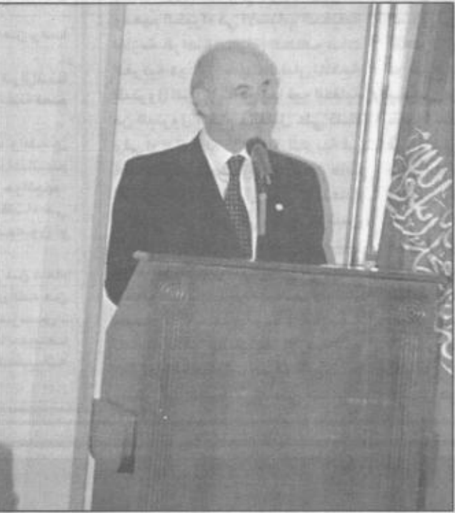
الرئيس الأرجنتيني لدى القائه كلمة في حفل العشاء

وانني على يقين ان شاء الله من حرص فخامتكم على بذل كل ما من شأنه الارتقاء بشؤوننا ومستوى العلاقات الثنائية حيث ان الامكانيات المتوفرة للتعاون تفوق بمراتب حجم ما حققناه إلى الآن. وفي الختام أكرر لفخامتكم بالغ الشكر والامتنان على ما أبديتوه من طيب المشاعر متطلعاً إلى اللقاء بفخامتكم في المملكة العربية السعودية ضيفاً كريماً بين اصداقنا والسلام عليكم. وحضر حفل العشاء الوفاء الرسمي المرافق لسمو ولي العهد كعادته حضره الوزراء الأرجنتينيون وعدد من كبار المسؤولين.