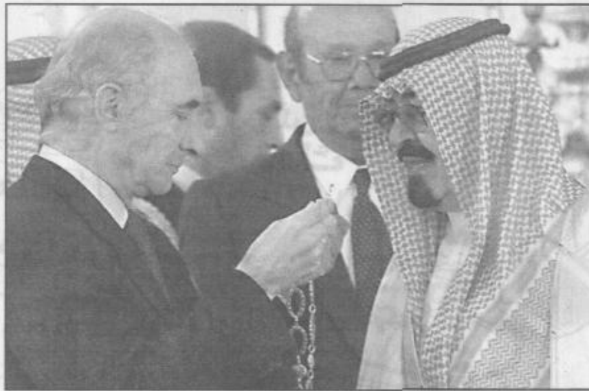
الرئيس الأرجنتيني يقبل سمو ولي العهد وسام «المحور»