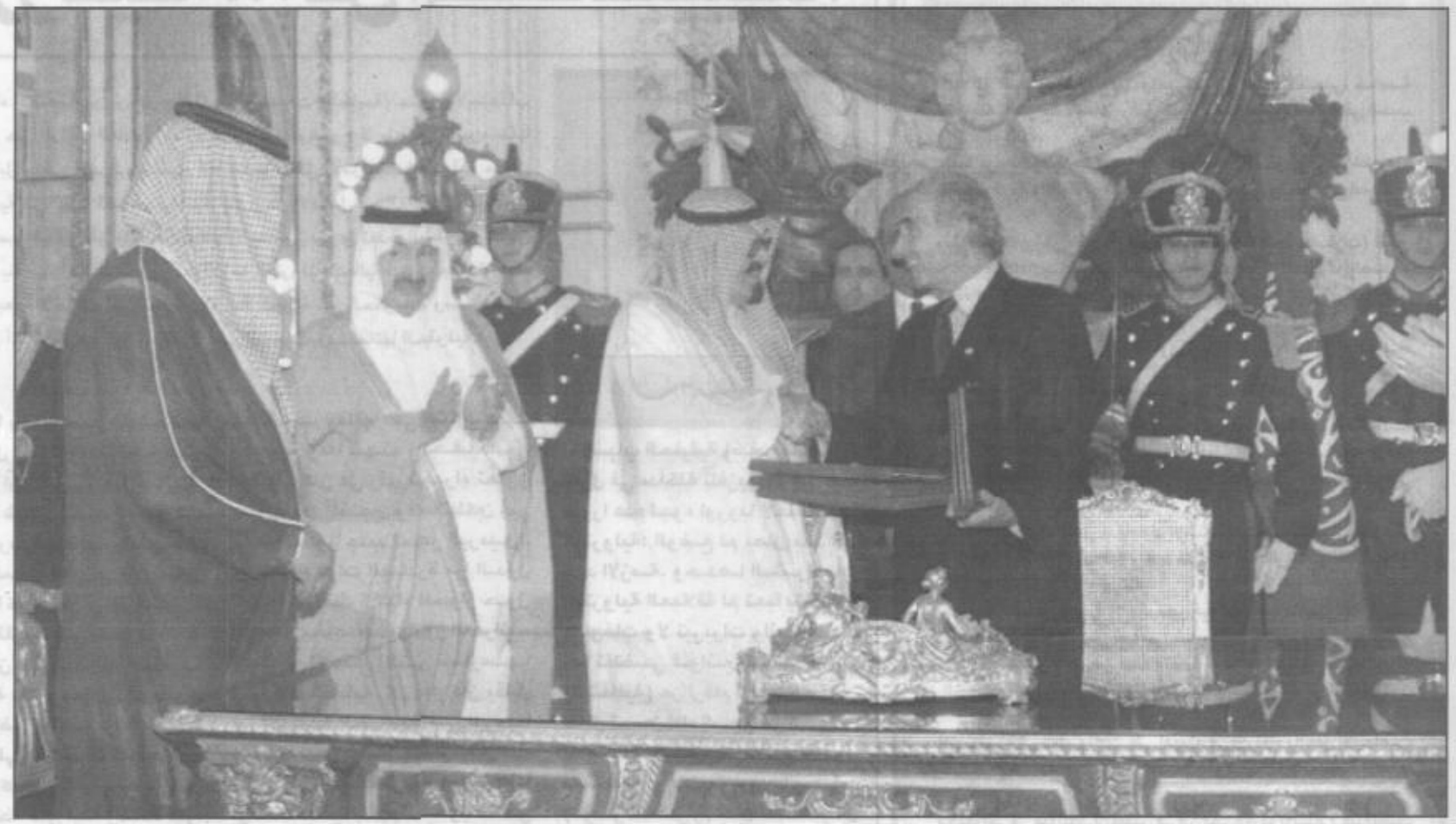
سمو ولي العهد مصافحاً الرئيس الأرجنتيني

ان المسافة الشاسعة التي تفصل بين بلدينا لم تشكل ولله الحمد عائقاً أمام سعينا المشترك لتكثيف مجالات التعاون الثنائي وإيجاد الأليات اللازمة لترجمة هذا التعاون إلى اتفاقيات وبرامج الحق والعدالة والتقدير بقواعد الشرعية الدولية في حل الخلافات والمنازعات. ومن هذا المنطلق فإننا نثيب حكومة الأرجنتين الاسهام في تحقيق السلام والاستقرار في منطقة الشرق الأوسط العربيين السابقين كارلوس منعم الصداقة مع حكومة وشعب الأرجنتين والتي شكلت علامة بارزة في طبيعة تعزيز العلاقات ودفعها إلى الامام. قائمة الرئيس: ان العلاقات بين الجمهورية