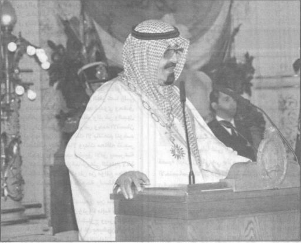
سمو ولي العهد يلقي كلمة في حفل العشاء

تستغل عملية السلام لتقويم علاقاتنا مع أعضاء المجتمع الدولي بما في ذلك الأرجنتين دون التقييد بمبادئ هذه العملية خاصة مبدأ الأرض مقابل السلام أو الوفاء بتعهداتها والتزاماتها مع أطراف التفاوض على مختلف مساراته.