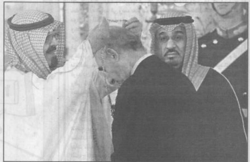
سمو ولي العهد يقبل الرئيس الأرجنتيني وسام الملك عبدالعزيز