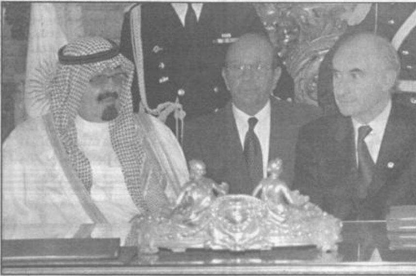
سمو ولي العهد مع الرئيس الأرجنتيني