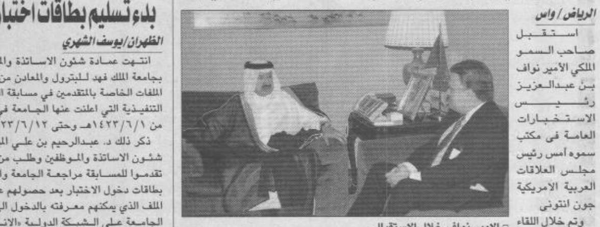
استقبال الأمير نواف خلال الاجتماع