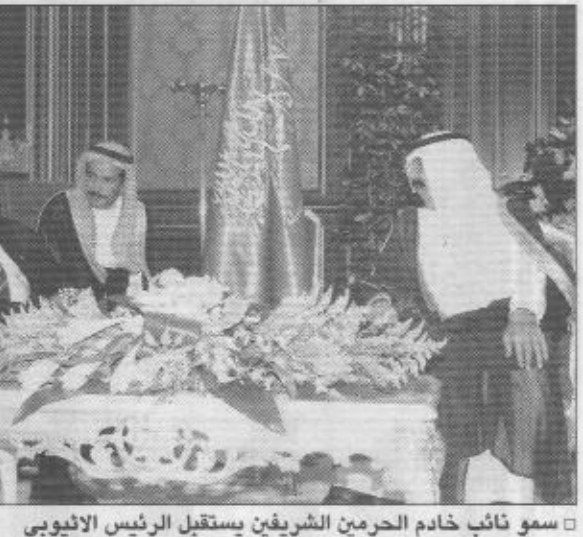
سمو نائب خادم الحرمين الشريفين يستقبل الرئيس الاثيوبي

تلقى صاحب السمو الملكي الامير عبدالله بن عبدالعزيز ولي العهد نائب رئيس مجلس الوزراء رئيس الحرس الوطني مزيدا من برقيات التهاني من أصحاب الفخامة والسو رؤساء وامراء الدول العربية والاسلامية بمناسبة اليوم الوطني للمملكة وهم: فخامة الرئيس / اسياق افورتي رئيس دولة اريتريا، صاحب السمو الملكي / حمد ابن عيسى آل خليفة ملك مملكة البحرين فخامة الرئيس / لانسانا كوتشي رئيس جمهورية غينيا فخامة الرئيس / ياسر عرفات رئيس دولة فلسطين فخامة الرئيس / علي عبدالله صالح رئيس الجمهورية اليمنية. سمو الشيخ / سلمان ابن حمد آل خليفة ولي العهد القائد العام لقوة دفاع البحرين سمو السيد / فهد بن محمود آل سعود نائب رئيس الوزراء بسطة عمان سمو الشيخ / راشد بن احمد العلا عضو المجلس الاعلى حاكم أم القيوين. سمو الشيخ / سقر بن محمد القاسمي حاكم إمارة رأس الخيمة. سمو الشيخ الفريق أول / محمد بن راشد آل مكتوم ولي عهد دبي وزير الدفاع بديوان الامارات العربية المتحدة. سمو الشيخ / حمدان بن راشد آل مكتوم وزير المالية والصناعة