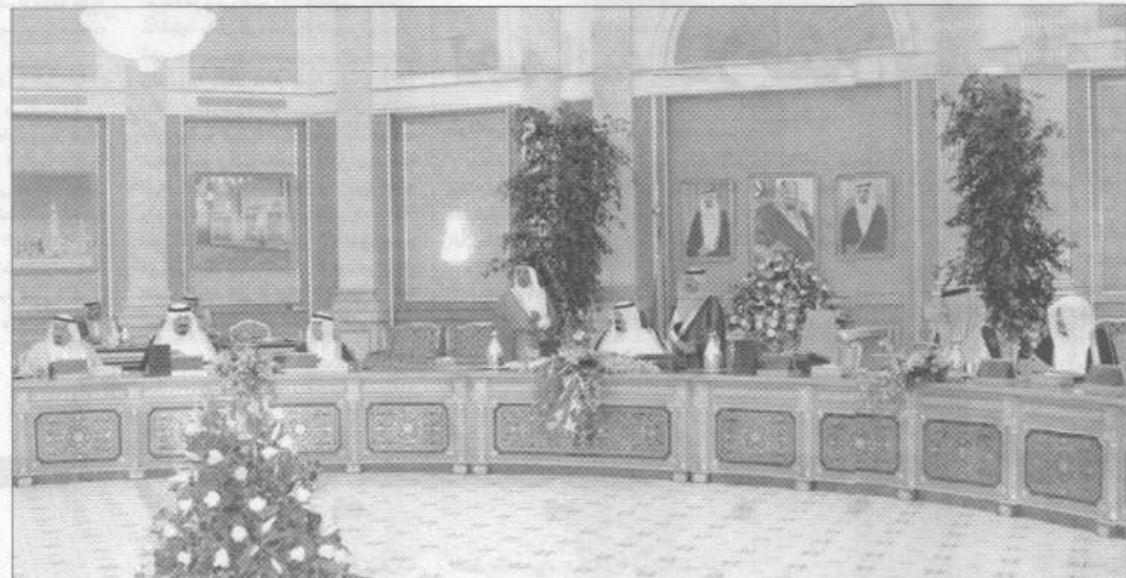
سمو نائب خادم الحرمين الشريفين يترأس جلسة مجلس الوزراء