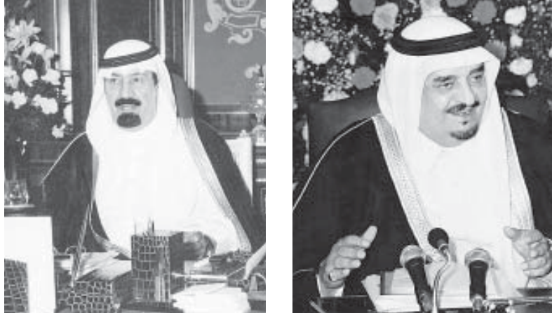
ومن مضاعفاتها، إضافة الى بحث ايجاد قاعدة بيانات المعاقين بوصفها الوسيلة الأفضل التي يتم من خلالها تحقيق الشمولية والتركيز في الرعاية والتأهيل. وستنطلق المهرجان الى الجهود

تحت رعاية خادم الحرمين الشريفين الملك فهد بن عبدالعزيز ال سعود - حفله الله - يفتتح صاحب السمو الملكي الأمير عبدالله بن عبدالعزيز ولي العهد نائب رئيس مجلس الوزراء ورئيس الحرس الوطني يوم الثلاثاء القادم المهرجان الأول لرعاية المعاقين وتأهيلهم الذي تنظمه وزارة العمل والشؤون الاجتماعية بمقر جامعة الامام محمد بن سعود الاسلامية في الرياض ويستمر لمدة ثلاثة ايام. اعلن ذلك وزير العمل والشؤون الاجتماعية الدكتور عبد بن ابراهيم النملة وقال في تصريح صحفي ان رعاية الملك المفدى وافتتاح سمو ولي العهد رعاها الله للمهرجان تجسد اهتمام الدولة بهذه الفئة الغالية من المجتمع وبينان حجم الدعم والرعاية التي يحظى بها المعاقون. ورفع شكره وتقديره لخادم الحرمين الشريفين وسمو ولي العهد وسمو النائب الثاني لوقوفهم الدائم ومساندتهم المستمرة لكل الجهود التي تبذلها وزارة العمل والشؤون الاجتماعية ومختلف القطاعات الأخرى الحكومية والإمالية التي تقدم خدماتها لفئة المعاقين. وبين الوزير النملة ان المهرجان الذي يقام تحت شعار (لنجعل من الاعاقة إنطلاقة) يستتالو عدداً من المحاور منها التعرف بالاعاقة والنوعا واسبابها وطرق التعامل معها ووسائل الواية منها، وكيفية التعامل نفسياً واجتماعياً مع المعاقين في الجانب العمي لإيجاد بيئة صحية واجتماعية مناسبة يقدم من خلالها خدمات تأهيلية متخصصة ومجدية للمعاقين والعاجزين ويناقش وسائل الاكتشاف والتدخل المبكر للاعاقات وذلك في وعلاجهما والحد منها