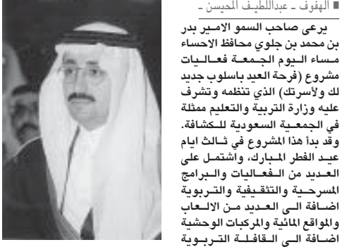
الامير بدر بن جلوي

يرعى صاحب السمو الامير بدر بن محمد بن جلوي محافظ الاحساء مساء اليوم الجمعة فعاليات مشروع (فرحة العيد بالسولب جديد لك والاسرتك) الذي تنظمه وتشرّف عليه وزارة التربية والتعليم ممثلة في الجمعية السعودية للتكشافة. وقد بدأ هذا المشروع في ثالث ايام عيد الفطر المبارك، واشتمل على العديد من الفعاليات والبرامج المسرحية والثقافية والترفيهية إضافة الى الألعاب والمواقع المائية والمركبات الوحية إضافة الى القافلة الترفيهية والتعليمية والترفيهية.