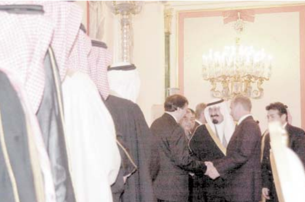
■ سمو ولي العهد يصافح مسؤولين روسيين