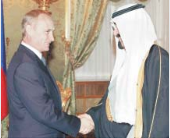
■ استقبال رسمي مميز