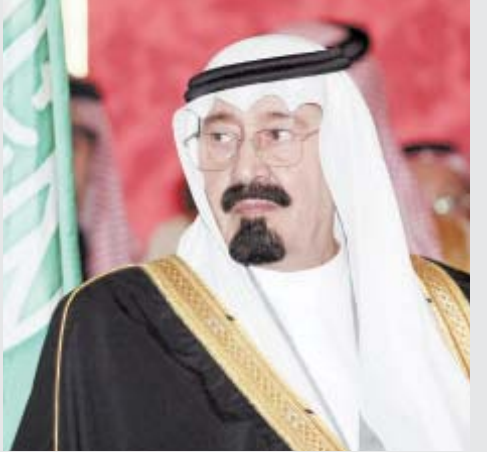
■ الأمير عبدالله يختتم اليوم زيارته التاريخية