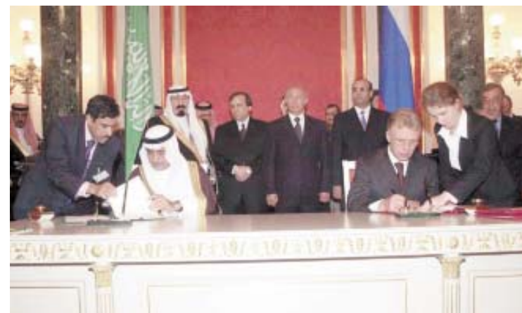
■ وزير المالية ونظيره الروسي يوقعان إحدى الاتفاقيات

وأشارت الى أن اقامة السفارة العربية السعودية في موسكو خطوة مهمة ودعت كل من ساء نظراً لحرصهما على احقاق الحقوق المشروعة للشعب الفلسطيني خاصة حقه في اقامة دولته. وأضافت صحيفة (ترود) تعتبر روسيا والمملكة العربية السعودية مهمتين ومتحدتين ومصيرين للنقط والغاز ومن مصلحتهما أن تتعاونوا وتتساق جهودهما في مجال صناعة النفط والغاز وهي عصب التنمية والتجارة والعلمي والفني بينهما