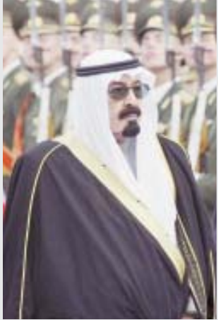
■ فخارة غير مسبوقة