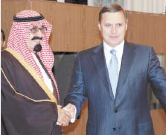
■ رئيس الوزراء الروسي يرحب بسموه