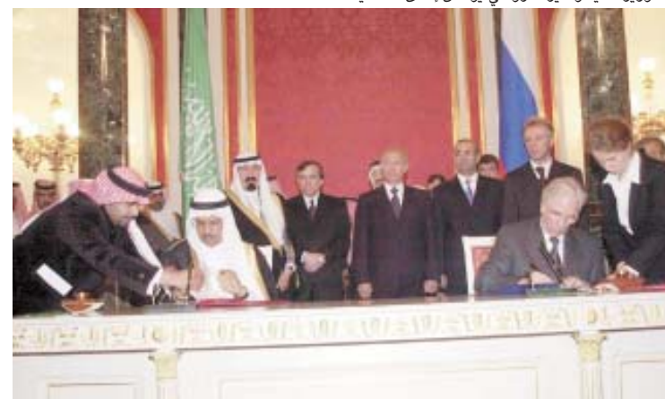
■ مسؤولون سعوديون وروس خلال التوقيع على إحدى الاتفاقيات