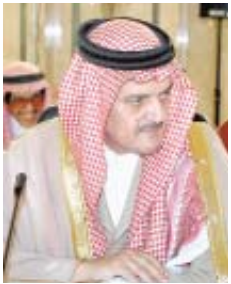
■ الأمير سعود الفيصل

تتولى معالجة كل القضايا المتعلقة بمكافحة الإرهاب الدولي. ووصف وزير الخارجية الروسي الاقتراح بإرسال قوات دولية للفصل بين الفلسطينيين والإسرائيليين بأنه يستحق الاهتمام. وأعرب إيفانوف عن استعداد بلاده للنظر في الاقتراح المذكور شريطة موافقة الطرفين المعنيين (الإسرائيلي والفلسطيني) عليه. ودعا الى ضرورة تطبيق خارطة الطريق التي تستجيب ومصالح الشعبين الفلسطيني والإسرائيلي وتحقيق السلام وتكفل الخروج من المأزق الراهن الذي تعاني منه المنطقة. وقال ان موسكو والرياض تريدان التعاون بشكل وثيق لمكافحة التهديدات التي تواجهها الأسرة الدولية ولا سيما الإرهاب. وشدد إيفانوف على ان المجتمع الدولي يواجه تهديدات عالمية مثل الإرهاب وعلينا التعاون بشكل وثيق لحل هذه المشاكل. مشيراً الى الدور الريادي الذي تضطلع به المملكة العربية السعودية في العالم العربي ولاسيما في إطار حل أزمة مثل مشكلة الشرق الأوسط والعراق.