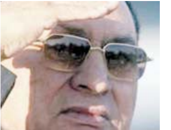
شرم الشيخ - اليوم