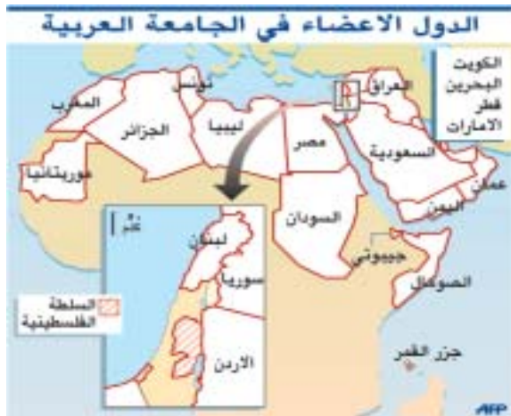
الدول الاعضاء في الجامعة العربية

المجالات صوناً للأمن القومي العربي ودفعاً للمخططات الأجنبية الرامية إلى النيل من سلامة الأمة العربية . كما تضمن الإعلان مطالبة برفع العقوبات عن العراق وإنهاء معاناة شعبه ورفضاً للتهديدات بالعدوان على الدول العربية وبصورة خاصة العراق ، وناكيد الرفض المطلق لضرب العراق أو تهديد أمن وسلامة أية دولة عربية أخرى. وتضمنت الدراسة كذلك البيان الصادر عن قمة بيروت بشأن طلب حماية المدنيين الأبرياء من أخطار المواجهة المتصاعدة بسبب السياسات العدوانية الاسرائيلية . ويأتي هذا الإصدار من مركز زايد للتنسيق والمتابعة الذي يعمل تحت مظلة جامعة الدول العربية ، متابعاً منه للقمم العربية والفعاليات جامعة الدول العربية في إطار دعم وتطوير العمل العربي المشترك من أجل تحقيق صالح وتقديم الامانة العربية .