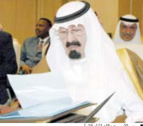
سمو الامير عبدالله اثناء القمة

التحرك السياسي اقليميا ودوليا خلال المرحلة القادمة . وقال : انها ستظل الاطار العام الذي يقضيه العرب وليس علامات طريق لا نهاية الى مشروع خارطة الطريق الذي طرحه وزير الخارجية الامريكي كولين باول قبل شهر ولم يجد دعماً حقيقياً من حكومة اريئيل شارون الاسرائيلية. وشد موسى على اهمية اتخاذ موقف عربي موحد عبر القمة لمواجهة المحاولات الاسرائيلية لتصفية القضية الفلسطينية كما دعا الى اتخاذ آليات متوازنة لدعم وحدة السودان وسلامة اراضيه والحرص على المصالحة الصومالية بالإضافة للقضايا الرئيسية الاخرى كالعراق.