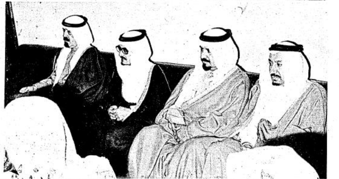
عاد جلالة الملك خالد بن عبدالعزيز المفدى بسلامته الله الى الرياض في الساعة السادسة من مساء امس قادما من المدينة المنورة بعد ان تفضل بافتتاح محطة تحلية المياه بالمدينة المنورة والتقى بالمواطنين هناك.. كما تفقد اهم المشروعات التي تنفذ في المدينة المنورة.