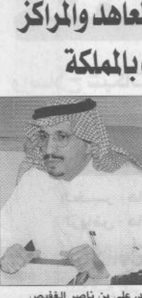
علي بن ناصر الغفيس

الغفيس يبحث مع ملاك ومسؤولي المعاهد والمراكز الفنية الأهلية صناعة التدريب بالمملكة الرياض / واس يلتقى محافظ المؤسسة العامة للتعليم الفني والتدريب المهني الدكتور علي بن ناصر الغفيس اليوم الاثنين ملاك ومسؤولي المعاهد والمراكز الفنية الأهلية التي تشرف عليها المؤسسة بالإضافة إلى مستفي التدريب الأهلي في مختلف مناطق المملكة وذلك بمجمع المؤسسة بحي الريان بالرياض. وأوضح مدير عام الإدارة للتدريب الأهلي الدكتور عبدالحميد بن عبدالرحمن العبدالجبار أن اللقاء يهدف إلى التواصل مع ملاك ومسؤولي المعاهد والمراكز الأهلية وتلمس حاجتهم والوقوف على أبرز المعوقات التي تحد من نمو صناعة التدريب بالمملكة مشيراً إلى أن اللقاء سوف يشهد تناول عدد من الموضوعات بغية إيجاد رؤى متطابقة تساهم في تطوير أداء مراكز ومعاهد التدريب الأهلي.