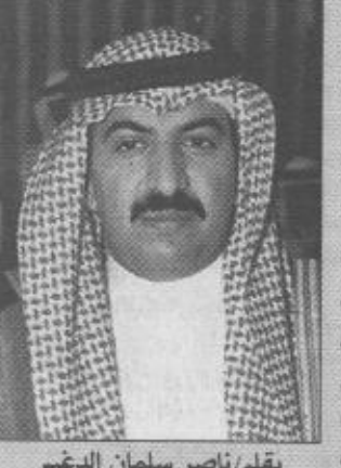
ب/قلم / ناصر سلمان الدخيم

إن زيارة صاحب السمو الملكي الأمير عبدالله بن عبدالعزيز للمنطقة الشرقية زيارة خير فتدشين هذه المصانع في الجبيل ورأس تنورة وغزلان جميعها أتت لراحة المواطن وليعيش في رغد من العيش وستجني أن شاء الله الأجيال القادمة ثمرة هذه المشاريع المعلاقة وأضاف القديم: أنه رغم الظروف الاقتصادية غير المستقرة التي يعيشها العالم بأسره إلا أننا هنا في المملكة العربية السعودية مالنا نبني عندما توقف الآخرون وجعلهم يعيدون حساباتهم وذلك بفضل الله تعالى ثم بفضل التخطيط الجيد والخطة المدروسة التي أتت ثمارها الآن وغداً إن شاء الله.. وأردف الدخيم بأن هذا الحب الكبير الذي يكنه هذا الشعب لهذه القيادة تابع مما تكنه هذه القيادة لهذا الشعب واستشهد القديم بخطاب صاحب السمو الملكي الأمير عبدالله بن عبدالعزيز في حفل الأهل والأذي عبر فيه عن هذه المحبة بقوله «أنتم قرة العين»