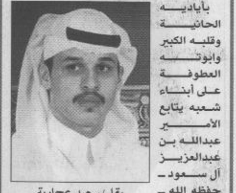
ب/قلم / سعيد عجاجية

التقدم في كافة المجالات لتحقيق الازدهار والرفاهية لابناء المنطقة الشرقية ولأن المملكة تؤمن بالحاضر وتتطلع للمستقبل فقد بدأت توجه إلى احتضان الأجيال الجديدة برعاية أكبر كوكتهم رجال الفد وصناع المستقبل الذين سوف يتحملون على المدى القريب مسئوليات بناء وطن تتوافر فيه كل عناصر التطور العلمي والتكنولوجي والرقمي المدني والعمراني.