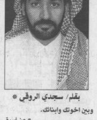
ب/قلم / سدي الروقي

بكل الحب والولاء استقبلت الشرقية أبنا متعب فماثلت الأمواج رذاذها وتبست الرمال عجاجها وورودها هكذا وبدون مقدمات فعبداً شقيق الفهد وعبيده والفهد خادم الحرمين الشريفين وناصر الإسلام والمستضعفين وهذا هو عبدالله احتضنته الشرقية فاخذ ينثر كميرات الخير فيدشن المصانع ويضع اللبنات الأولى لمشروعات أخرى.. كل ذلك من أجل اسماء وزفاهية المواطن وهذه الراهبية كانت الشغل الشاغل لهذه الحكومة الفقيه هذا عبدالله شقيق الفهد يبدأ بيد وجنبا إلى