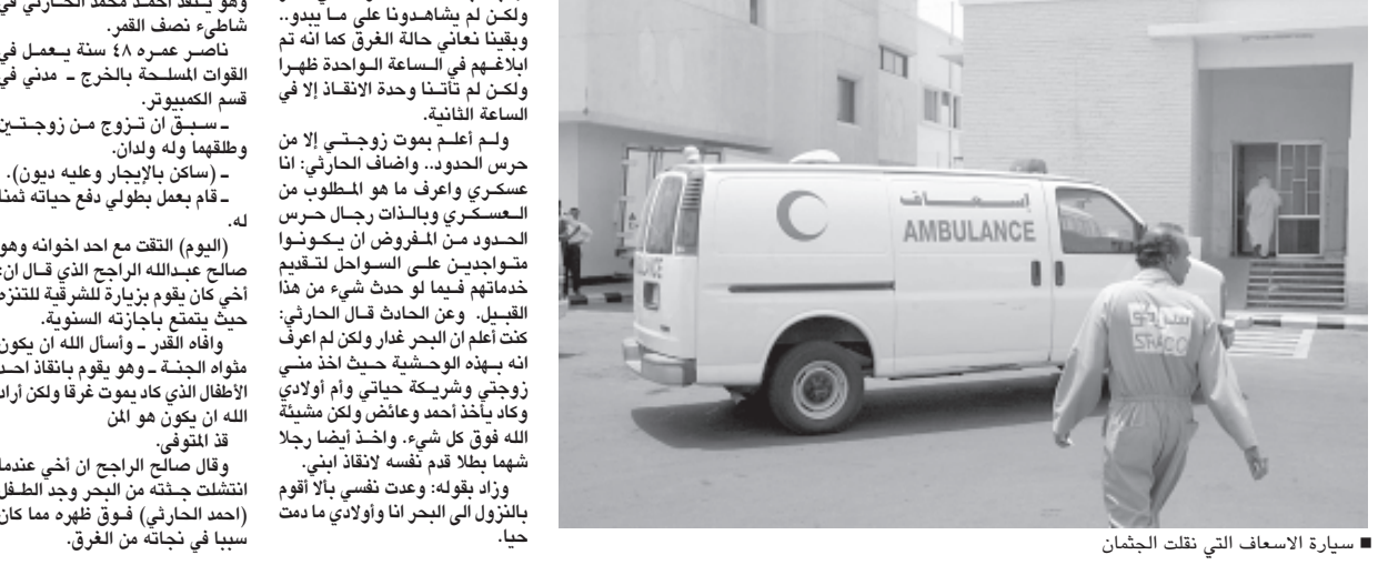
سيارة الاسعاف التي نقلت الجثمان