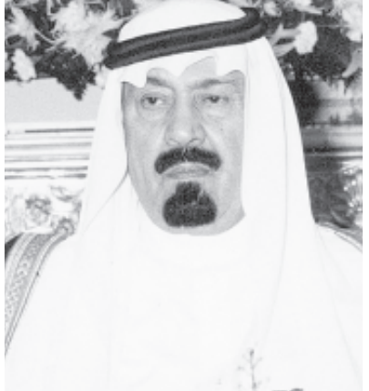
الأمير عبدالله بن عبدالعزيز

التدريين فيها والخدمات التي يقدمها مركز خدمة المجتمع والتدريب المستمر والشركات الداعمة للمعايير المهنية الوطنية والحقائب التدريبية في المؤسسة وجهود أصحاب السمو أمراء المناطق في إنشاء برامج لتدريب وتوظيف الشباب. ثم تشرف بالسلام على سمو ولي العهد الطلاب المتفوقون في فروع المؤسسة الذين شاركوا في المسابقة المهنية الدولية التي أقيمت مؤخرا في سويسرا. بعد ذلك تفصل صاحب السمو الملكي الأمير عبدالله بن الحرس الوطني بأزاحة الستار عن اللوحة التذكارية للكلية قائلا: بسم الله الرحمن الرحيم.. وعلى بركة الله.. اللهم اجعل فيها البركة والخير للشعب السعودي. وفي نهاية الحفل عرّف السلام الملكي.. ثم غادر سمو ولي العهد مقر الحفل مودعا بمثل ما استقبل به من حفاوة وتكريم. حضر الحفل صاحب السمو الملكي الأمير متعب بن عبدالعزيز وزير الشؤون البلدية والقروية وصاحب السمو الملكي الأمير نواف بن عبدالعزيز رئيس الاستخبارات العامة وصاحب السمو الأمير فيصل بن تركي آل سعود وصاحب السمو الأمير فهد بن عبدالله بن محمد آل سعود مساعد وزير الدفاع والطيران لشؤون الطيران المدني وصاحب السمو الأمير فيصل بن عبدالله بن محمد آل سعود مساعد رئيس الاستخبارات العامة وصاحب السمو الملكي الأمير محمد بن سلطان بن محمد آل سعود مدير عام المتابعة بوزارة الداخلية وصاحب السمو الملكي الأمير عبدالعزيز بن عبدالله بن عبدالعزيز المستشار في ديوان سمو ولي العهد وصاحب السمو الملكي الأمير مشعل بن عبدالله بن عبدالعزيز وصاحب السمو الملكي الأمير سعود بن عبدالله بن عبدالعزيز وصاحب السمو الملكي الأمير مساعد بن عبدالله بن عبدالعزيز وأصحاب المعالي الوزراء وكبار المسؤولين من مدينتين وعسكريين.