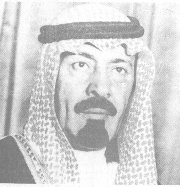
سمو الأمير عبد الله