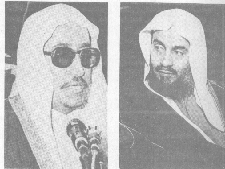
وزير التعليم العالي الشيخ حسن آل الشيخ

مكتبات .. ولكن اين التنسيق كثير المكتبات في الرياض العاصمة .. اليس هناك تنسيق مع جامعة الرياض .. دار الكتب الوطنية .. معهد الادارة وغيرها في هذا المجال دكتور !! ج - الواقع ان هناك دعوة لعقد لقاء مع المسؤولين عن المكتبات في المملكة وفي ضوء هذا اللقاء سيتم دراسة المشكلات التي تعترض اوضاع المكتبات ..