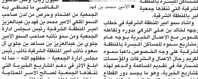
الأمير محمد بن فهد

باعت خادم الحرمين الشريفين الملك فهد ابن عبد العزيز آل سعود (حفظه الله) برقية تهنئة لفخامة الرئيس موى كيني رئيس جمهورية كينيا بمناسبة ذكرى استقلال بلاده. وأعرب الملك المفدى باسمه والشعبين الصديقين.