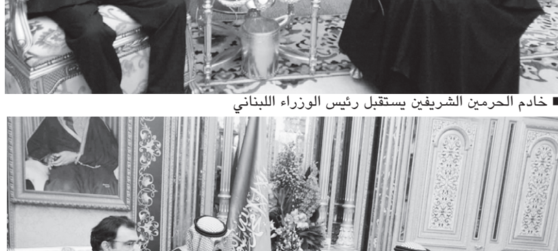
خادم الحرمين الشريفين يستقبل رئيس الوزراء اللبناني

استقبل خادم الحرمين الشريفين الملك فهد بن عبدالعزيز آل سعود (حفظه الله) في مكتبه بقصر اليمامة امس دولة رئيس وزراء الجمهورية اللبنانية عمر كرامي والوفد المرافق له. وقد رحب خادم الحرمين الشريفين بدولة رئيس وزراء لبنان في بلده الثاني المملكة العربية السعودية متمنيا له طيب الإقامة. ونقل دولته لخادم الحرمين الشريفين تحيات وتقدير فخامة الرئيس اللبناني اميل لحود فيما حصله ايده الله تحياته وتقديره لفخامته ولحكومة وشعب الجمهورية اللبنانية الشقيق. واستعرض خادم الحرمين الشريفين ودولة رئيس وزراء لبنان مجمل الأوضاع على الساحات العربية والإسلامية والدولية وخاصة الأوضاع في الأرض الفلسطينية المحتلة والعراق.