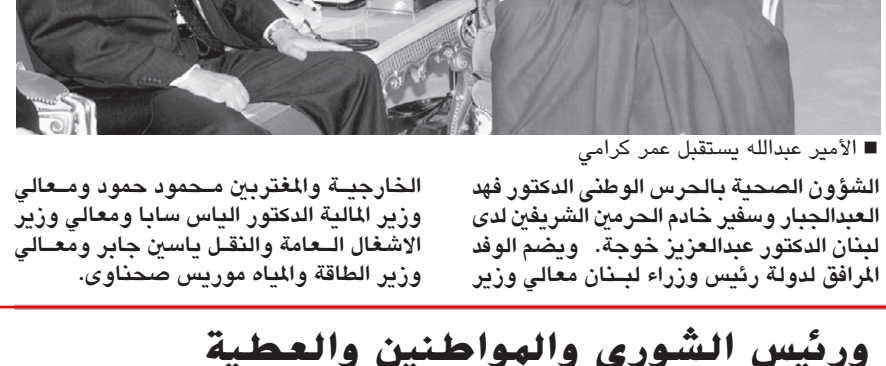
الأمير عبدالله يستقبل عمر كرامي الشؤون الصحية بالحرس الوطني الدكتور فهد العبدالجبار وسفير خادم الحرمين الشريفين لدى لبنان الدكتور عبدالعزيز خوجة، ويضم الوفد المرافق لدولة رئيس وزراء لبنان معالي وزير الطاقة والمياه موريص صحنواي.

استقبل صاحب السمو الملكي الأمير عبدالله بن عبدالعزيز ولي العهد نائب رئيس مجلس الوزراء رئيس الحرس الوطني في مكتبه بالديوان الملكي بقصر اليمامة أمس دولة رئيس وزراء لبنان عمر كرامي والوفد المرافق له. وجرى خلال الاستقبال بحث مجمل الأحداث والمستجدات على الساحات العربية والإسلامية والدولية إضافة إلى اتفاق التعاون بين البلدين وسبل دعمه وتعزيزه في جميع المجالات. حضر الاستقبال صاحب السمو الأمير الدكتور بندر بن سلمان بن محمد آل سعود المستشار في ديوان سمو ولي العهد وصاحب السمو الملكي الأمير عبدالعزيز بن فهد بن عبدالعزيز وزير الدولة عضو مجلس الوزراء رئيس ديوان رئاسة مجلس الوزراء ومعالي وزير الدولة عضو مجلس الوزراء لشؤون مجلس الشورى الدكتور سعود المتحمي ومعالي المستشار في ديوان سمو ولي العهد الأستاذ عبدالمحسن بن عبدالعزيز التويجري ومعالي المستشار في ديوان سمو ولي العهد المنذوب المفوض على