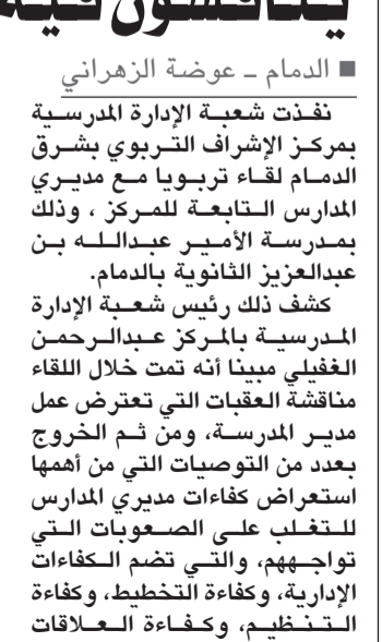
اللقاء التربوي بشرق الدمام