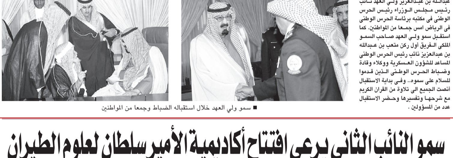
سمو ولي العهد خلال استقباله الضباط وجمعا من المواطنين