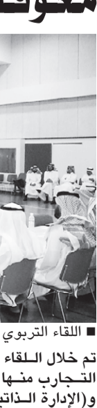
اللقاء التربوي بشرق الدمام