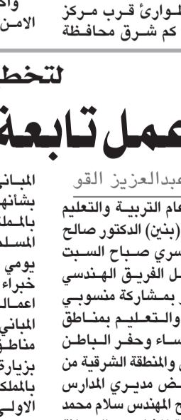
اللقاء التربوي بشرق الدمام