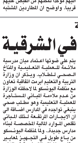
اللقاء التربوي بشرق الدمام